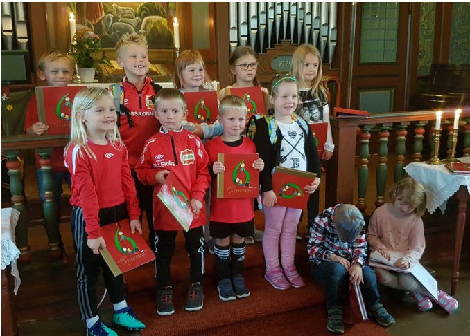
Skolestartere Løkken kirke