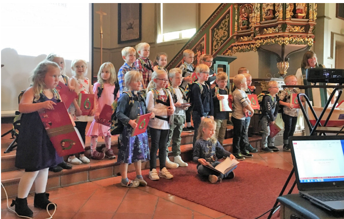
Skolestartere Meldal kirke