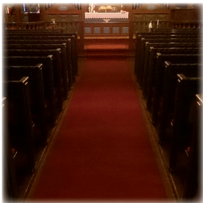
Ny løper i Løkken kirke

Løperne i begge kirkene var utslitt. På Løkken var det så stort hull i løperen at det var en risiko for at noen kunne snuble. I Meldal begynte løperen å rakne langs kantene. Denne sendte vi til Bergen for å få kantet opp igjen, men det var mislykket. Vi fikk frigjort midler, kr. 100.000,- fra et fond som er til forskjønnelse av kirkene. Det var Nidaros bispedømme som gav tillatelse til dette. De nye løperne er levert av Ledaal Teppeveveri i Stavanger.