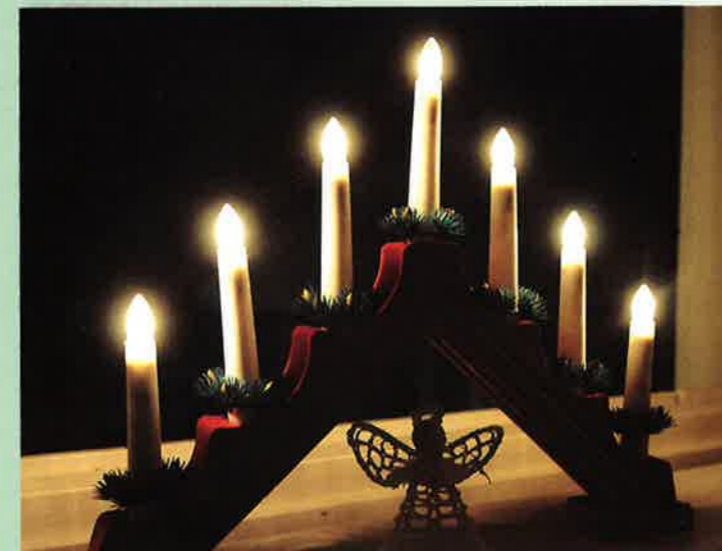
Den syvarmete lysestaken er et vanlig syn i norske hjem i advent og jul.

En natt våknet familien av et forferdelig bråk. Noen hadde knust vinduet og lysestaken! De voksne i huset hadde opplevd Europa både før og under 2. verdenskrig, og de husket godt hva som skjedde da mange mennesker ble drept fordi de var jøder. Det var vonde minner for de voksne, og alle i huset ble redde. Naboene kom til dem og trøstet så godt de kunne. Vinduet ble reparert, og familien reiste vekk en stund. Da de kom hjem, hadde det skjedd noe: hele gaten lyste opp og var enda vakrere enn før de dro. Da hadde alle naboene satt hver sin menorah i vindu-