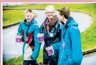
Tusener av konfirmanter og voksne går med bøsse for Kirkens Nødhjelps fasteaksjon, landets nest største bøsseaksjon. Les om årets fasteaksjon på side 5