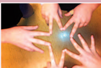
Orkdal Soul Children Les mer side 4