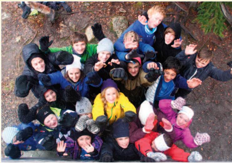
Herlig med leir!