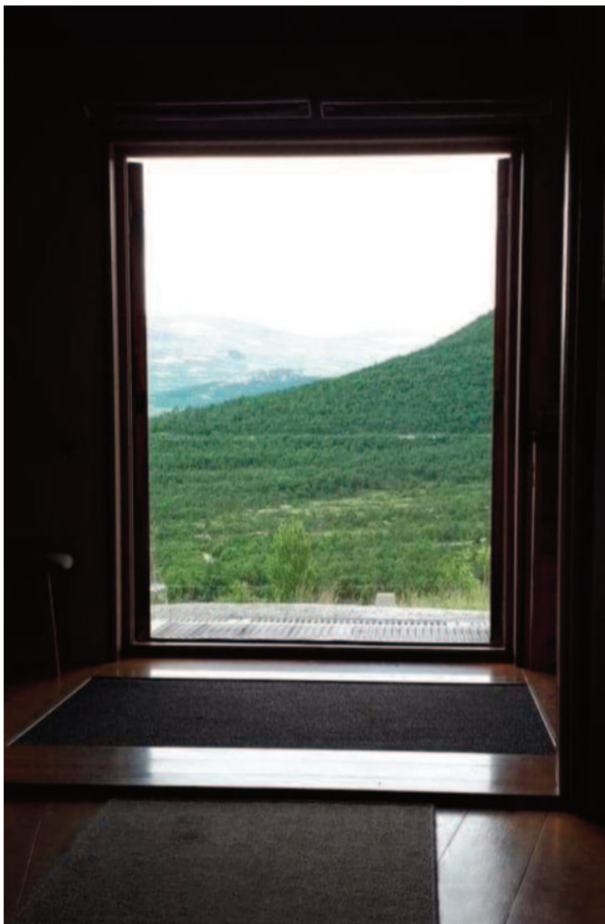
Fra Eysteinkyrkja på Hjerkin som er åpen hele sommeren for pilegrimer og turister og hvem som helst.

Når vi møtes til gudstjeneste på søndag, møtes vi i Guds hus, som ordet kirke egentlig betyr. Der får alle som vil komme og delta, og for mange var første kirkebesøk da de ble båret til dåpen. I dåpen var det andre som tok oss dit, for de ville oss det beste i livet.