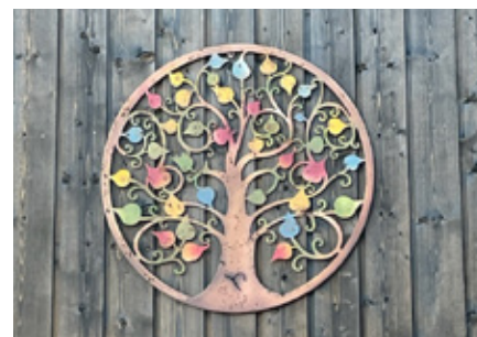
Livets tre slik det henger på husveggen.

Og finner du ham i krybbens hø som hyrder så, som hyrder så, Da eier du nok til freidig å dø, og leve på, og leve på.