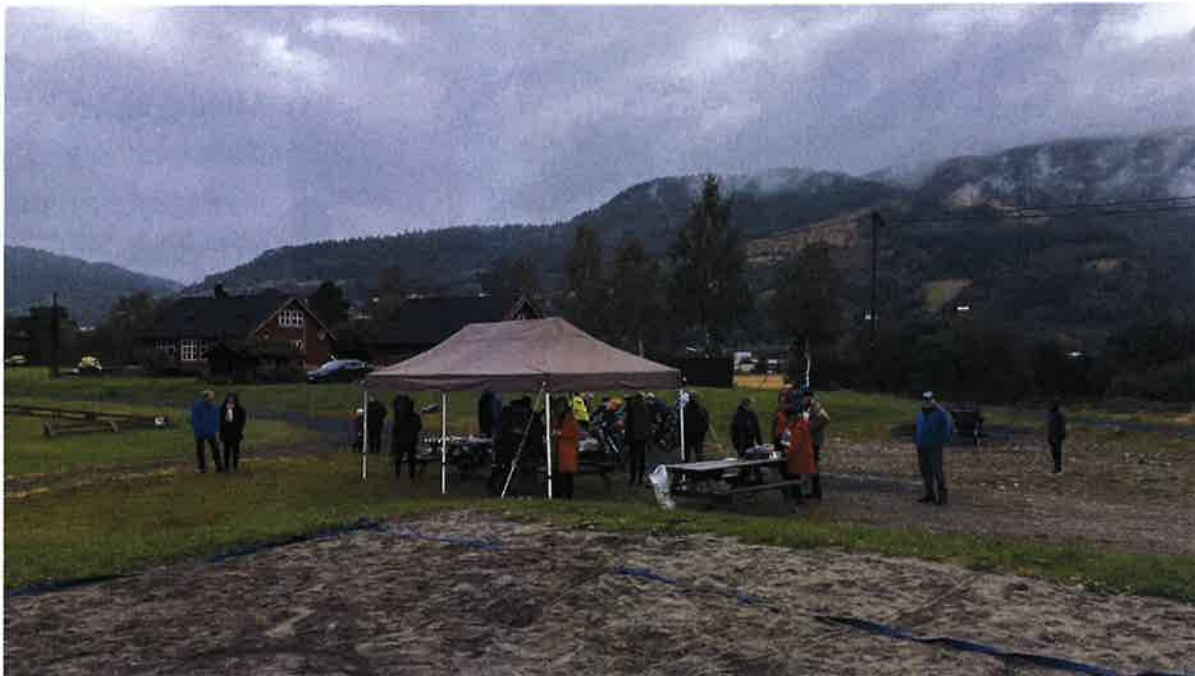
Sponsorløp og misjonsfest

I løpet av 2021 har vi heldigvis kunnet gjennomføre en del av våre tiltak til tross for pandemien. Vi gleder oss til en normal hverdag, der diakonien og frivilligheten berører mange mennesker og samler enda flere til fellesskap.