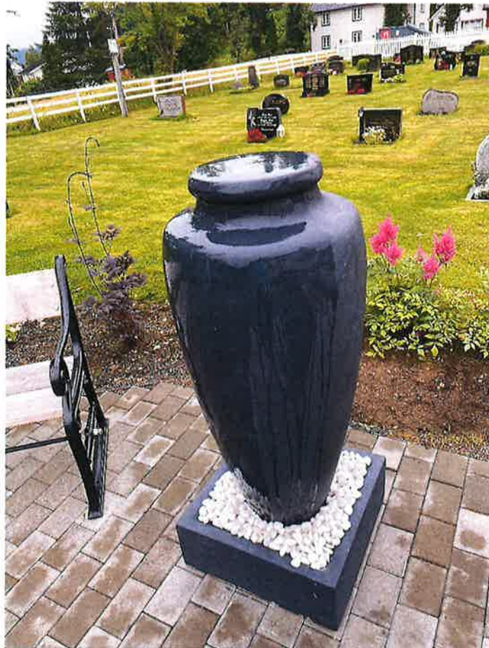
FONTENE MOE KIRKE, ORKLAND