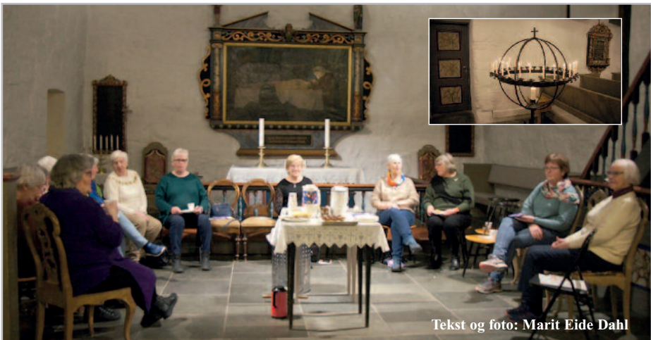
Tekst og foto: Marit Eide Dahl

«For jeg vet hvilke tanker jeg har med dere» Kunstner: Angie Fox - en britisk kunstner som broderer og designer liturgiske klær.