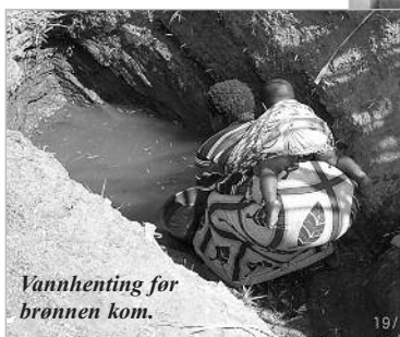
Vannhenting for brønnen kom.

Vi vet at pengene når frem og at verden blir et bedre sted for ALLE som får rent vann. Barn og voksne ute på landsbygdene i Malawi er verdige mottakere av også årets Fosengave.