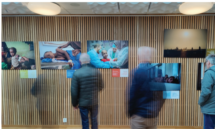
Mange besøkte utstillinga "Ser alt du er" frå Kirkens Nødhjelp i Os kyrkje og Tunet i fastetida.