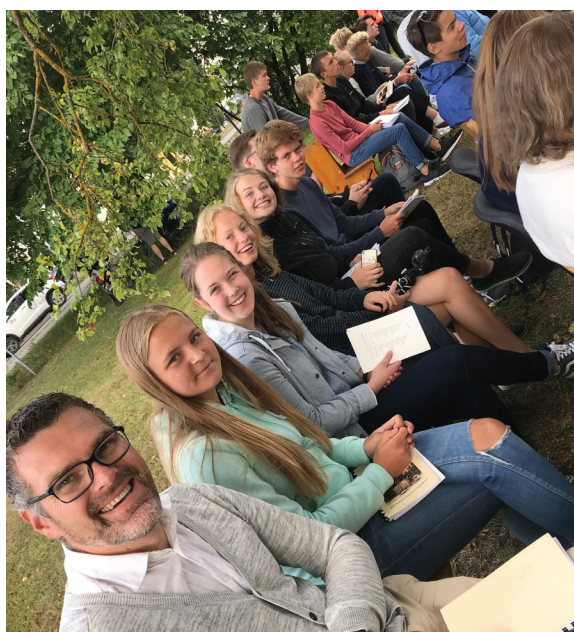
Osingar på gudsteneste utanfor bedehuset i Saku, august 2019