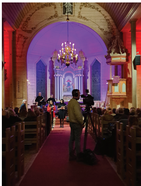
Solidaritetskonserten til inntekt for ofra i Ukraina i desember 2022 fekk dekning frå m.a. NRK Vestland, og det kom inn over 70.000 kroner i laupet av kvelden