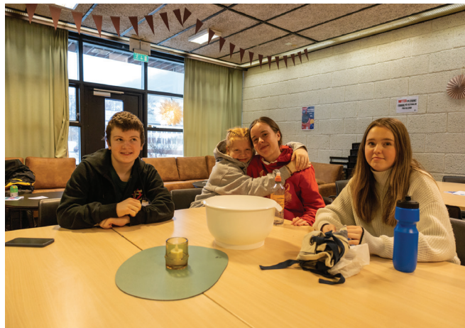
Godt humør òg i bakegruppa.

Kveldsshowet på laurdagen var enda eit av festivalens høgdepunkt. Under showet var fleire av einingane på scenen for å framføre ei song. JoinUs var siste gruppa ut med songen «Hjerteknuser» av Kaizers Orchestra. Det var kjekt å sjå og høyre dei dyktige ungdommane i JoinUs oppe på scenen. Det vil være mogleg for fleire å oppleve dette på JoinUs si vårkonsert i tunet onsdag 24.mai.