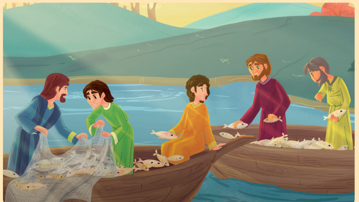
Teikning: Claudia Chiaravalloti