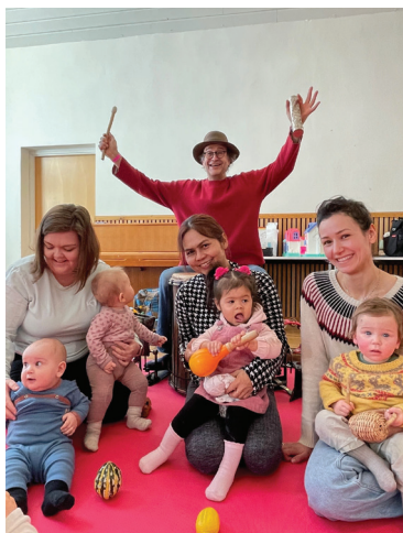
“Trommelars” skapar musikkglede og (litt ekstra) liv og røre på KFUK-KFUM Åpen barnehage i Tunet om lag ein tysdag i månaden