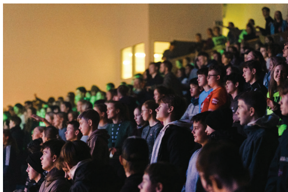
Om lag 60 konfirmantar frå Os deltok på leiren konfACTION Vest 2023 på Framnes VGS i februar.