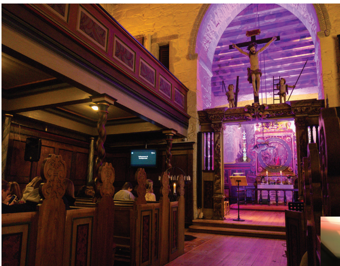
Vangskyrkja midt i Voss sentrum er flott utanpå og minst like flott inni!