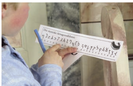
En beskjed var gitt i koder, og agentene måtte bruke et hemmelig alfabet og få hjelp av de andre for å få hele beskjeden fram.