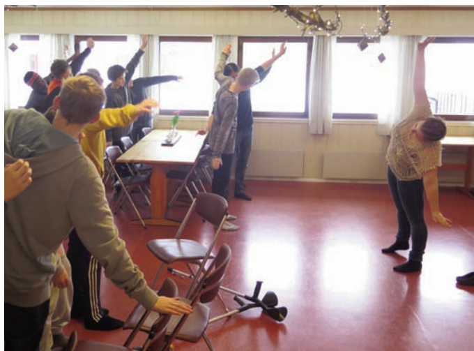
Litt morgengymnastikk hjelper med å komme i gang med en ny dag.