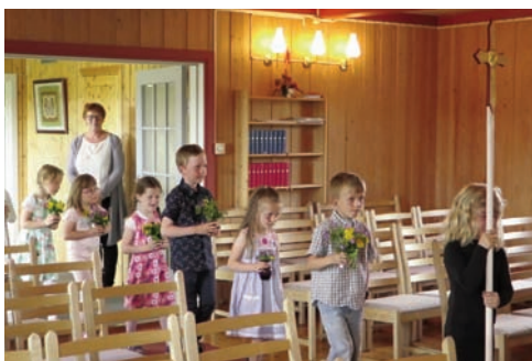
Det er både høytidelig og fint å komme inn i prosesjon med blomster og prosesjonskors.

Gudstjenesten begynte med at sjuåringene kom inn i prosesjon og pyntet alterringen med markblomster. Deretter var de med og ledet samlingsbønnen, hjalp til med evangelieprosesjon og fikk utdelt en barnebibel, og tente lys under forbønnen. Etter gudstjenesten var det is til alle, og saft og kaffe.