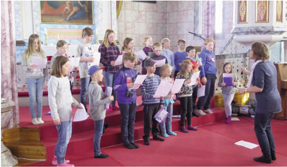
Årets tårnagenter var en sangglad gjeng, og tårnagensangen fylte kirkerommet!