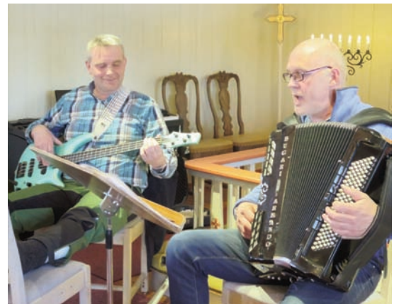
Dyktige musikere sørget for at det var lett å synge og følge sangen.