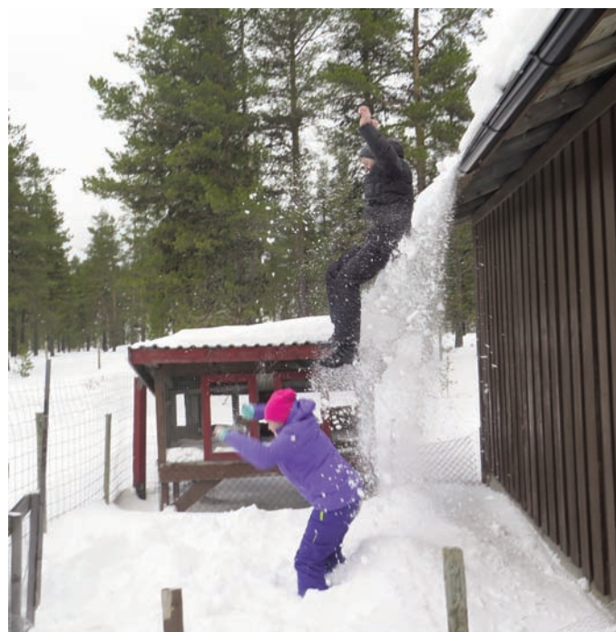
... og ned igjen på andre sida.