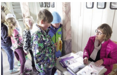
Tårnagentene møter opp i våpenhuset, avgir agentkoden sin og får med seg agentutstyret de trenger til oppgavene.