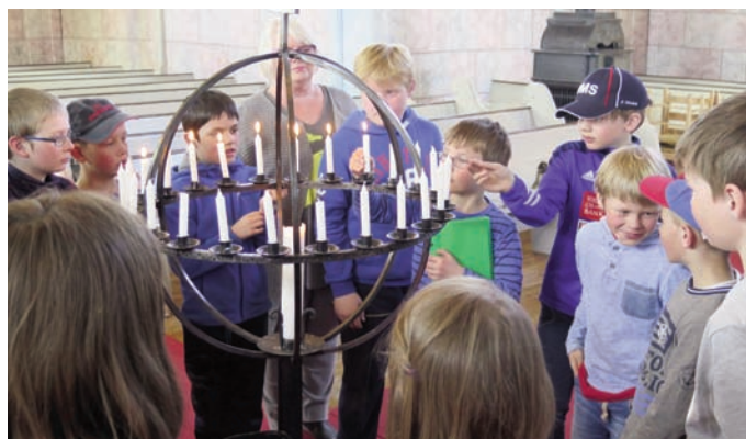
Som avslutning på lørdagen, tente tårnagentene lys for hverandre. Det ble en stemningsfull avrundning av dagen.

Dermed var vi klare for gudstjeneste. Alle ville være med å vise hva de hadde lært om pinsehøytiden. Sangen gikk kjempebra, og alle sang av full hals! Dramatiseringen av teksten gikk uten problemer og alle fant plassene sine og var der til de var ferdige. Agentene var også veldig flinke under forbønnen. Til slutt samlet vi oss i Kirkestua for agentsaft/kaffe og kaker. Helge viste oss bilder fra lørdagen. Det er fint når foreldre og andre interesserte kan få se hva vi holder på med. Så var det slutt; noen kan dra hjem og vente på neste tårnagenthelg, de eldste kan se fram til Lys våken i Dalsbygda kirke i høst!