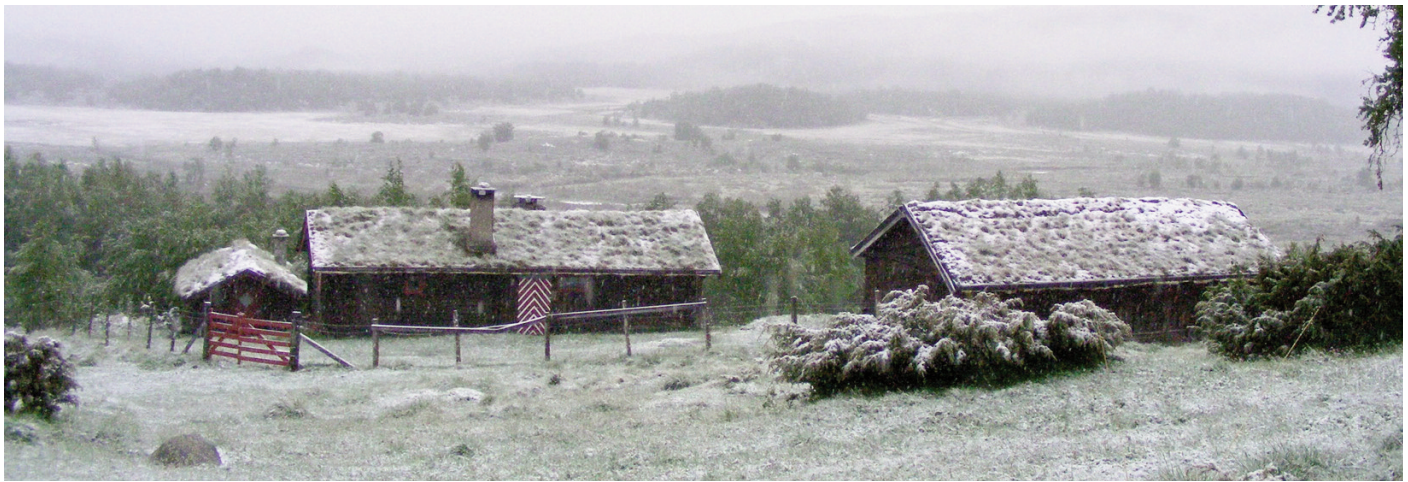
Bilde fra Listuvollen tatt 13. juni 2007 av Helge Ytterhaug. Den gangen la snøen et hvitt teppe over nyutsprunget gress. Vi håper på noe mildere vær i august, og ønsker alle hjertelig velkommen!