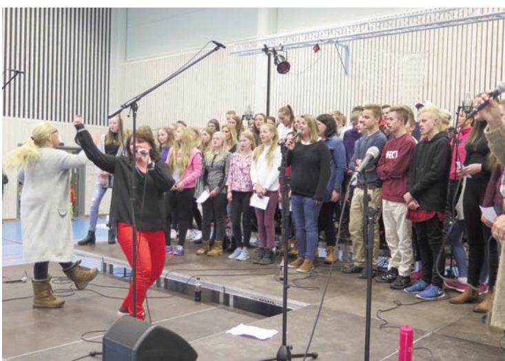
Nittedal gospelkor dro med seg konfirmantene og ga dem frimodighet til å synge ut!

Vi takker konfirmantene og Nittedal gospelkor for en godt gjennomført konsert, og gleder oss til neste FjellGospel!