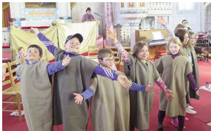
Tårnagentene over på å vise pinsefortellingen, bl.a. hvordan apostlene gikk glade ut i verden etter å ha fått Den hellige ånd.