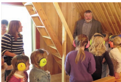
Den som vil bli med opp når klokkene ringer, må ha hørselvern.