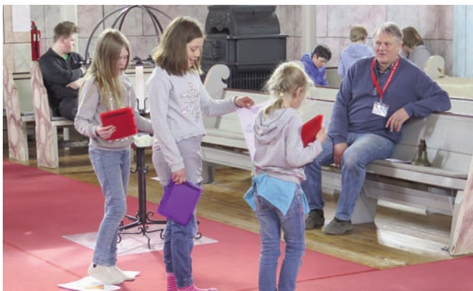
En morsom samarbeidsoppgave var å komme seg over kirkegulvet uten å trække på teppet. Eneste tillatte hjelpemiddel var noen papirark.