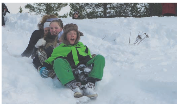
Gøy med aking i dødisgropa!