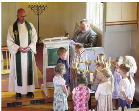
Sjuåringene tente lys under forbønnen og hadde bestemt forbønnsemnene på forhånd.