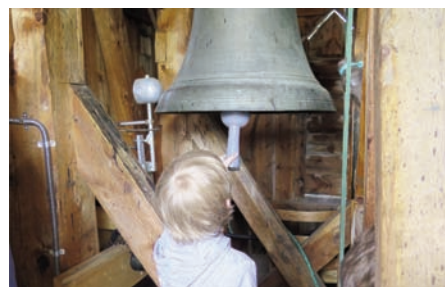
En tårnagent må selvsagt gjøre seg kjent med tårnet og kirkeklokkene.