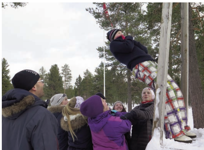
Her må man stole på at de som står bak deg, tar imot.

Den første helga i februar var konfirmantene på leir på Tron ungdomssenter. Det ble som vanlig en helg full av aktiviteter og opplegg, og konfirmantene så ut til å trives med opplegget. Her viser vi noen glimt av noe av det vi dreiv med denne helga.