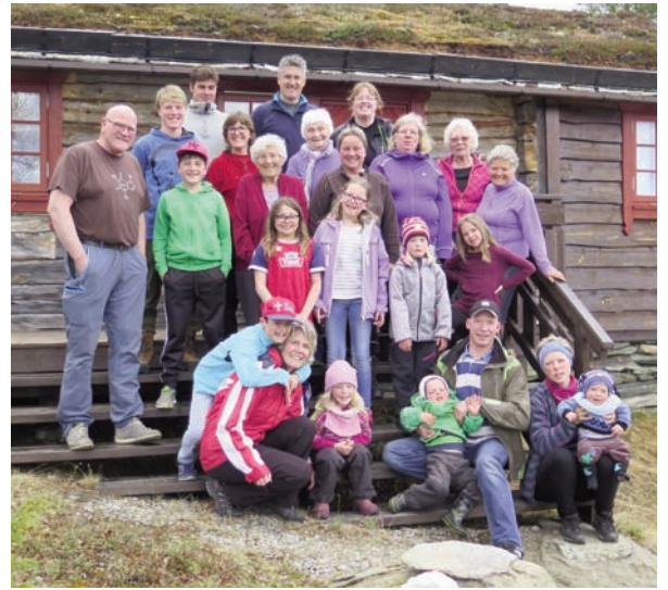
Familiekoret har flere sosiale samlinger i løpet av året. Her fra sommerfesten på Myklebu i Narjordslia.