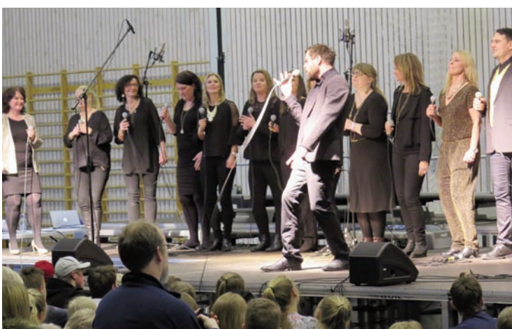
Koret har gode solister, og hadde en egen avdeling i midten av konserten.