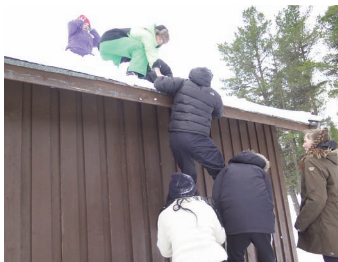
Samarbeid for å komme opp på taket på bua...