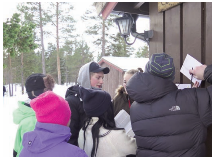
Dyp konsentrasjon når konfirmantene løste oppgaver på poster rundt omkring på Tron ungdomssenter.