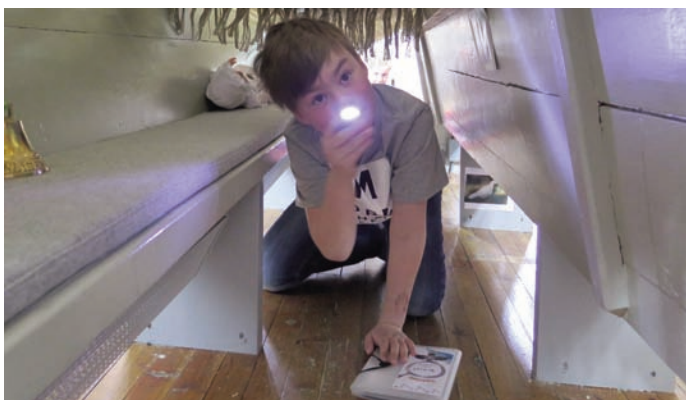
Her er det gjemt ulike ting og bilder som handler om pinsen, og agentene måtte lete grundig for å finne alle.