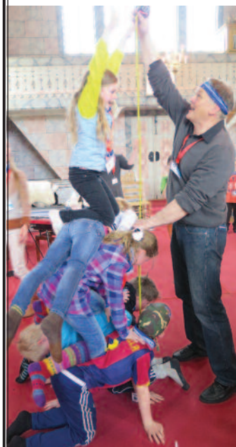
Fjorårets tårnagenter i full gang med en av oppgavene – å lage et menneskelig tårn.

Tårnagenthelga er to dager med ulike agentoppdrag, leker og fortellinger i kirkerommet og på kirkestua. Mer kan vi ikke fortelle – det er hemmelig og forbeholdt de som melder seg som tårnagenter i april!