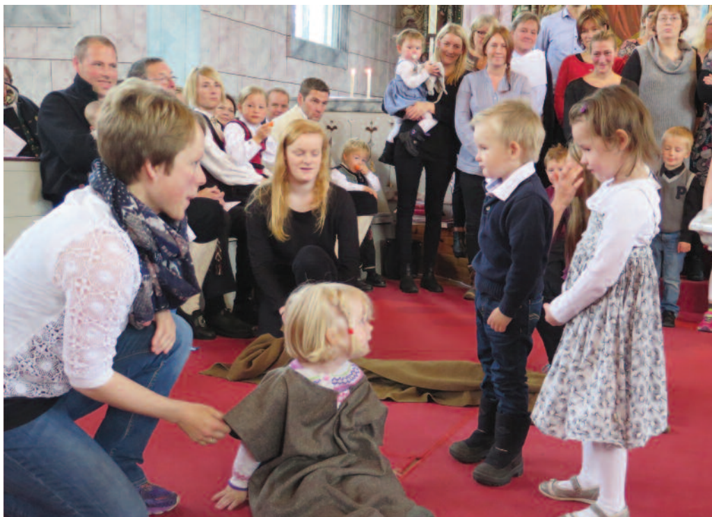
Her har mannen som er på vei til Jeriko akkurat blitt angrepet av røvere, og trenger hjelp.

Det har lenge vært tradisjon å invitere fireåringene til å komme i kirken og få Min kirkebok. I år fikk fireåringene en mer aktiv rolle i gudstjenesten enn tidligere. For de var med på å framføre fortellingen om den barmhjertige samaritan som en liten musikal.