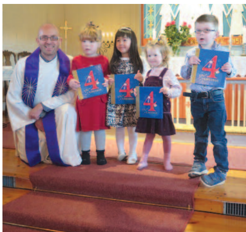
Stolte fireåringene fikk Min kirkebok, og tusen takk for innsatsen i musikalen.

I Dalsbygda kirke ble også musikalen framført. Her var det konfirmantene som tok ansvar for de fleste rollene i fortellingen, mens fireåringene fikk lov til å være det de hadde mest lyst til: røvere. Menigheten ble lært opp i sangene på forhånd og tok rollen som kor i musikalen. Det ble en glad og god gudstjeneste med engasjement fra alle som var til stede.