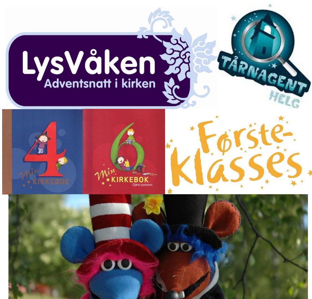
Kirkerottene kommer til Vestre Aker kirke i 2019

tilbud til alle aldersgrupper. Trosopplæringsutvalget ønsker at det skal være godt samspill mellom breddetiltak og kontinuerlig barne- og ungdomsarbeid.