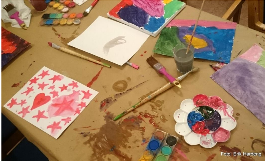
Små og litt større barn laget en flott høstutstilling til høsttakkefesten.