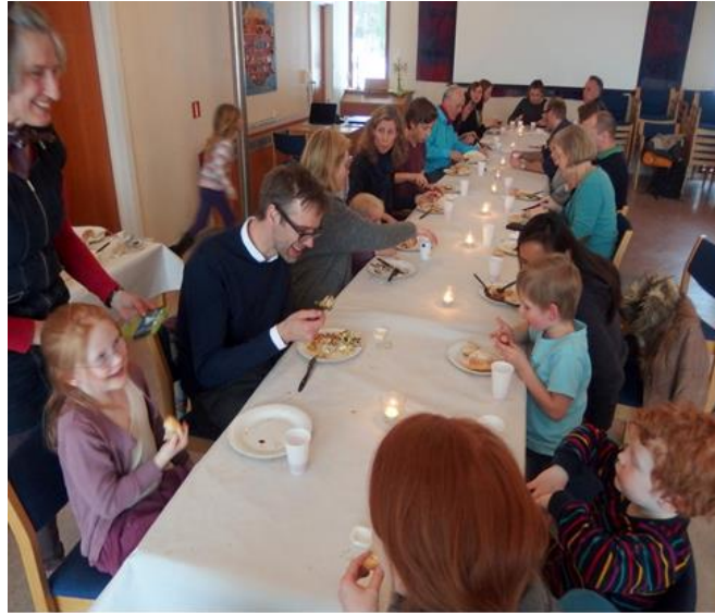
Supermandag i Bakkehaugen kirke for store og små.