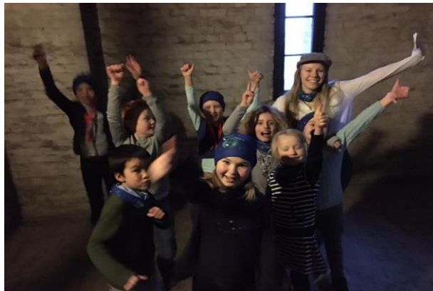
Tårnagenter 2017 i klokketårnet i Vestre Aker kirke

Tårnagenthelg ble gjennomført med åtte tredjeklassinger tidlig på året. Lys Våken ble et innholdsrikt døgn med 15 deltakende 6. og 7. klassinger. Nytt av året var at det ble invitert til et trosopplæringsarrangement for 2.-5. klasse i forbindelse med høsttakkefesten. Dette skal videreutvikles.