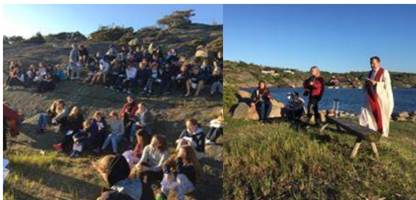
Konfirmanter på leir