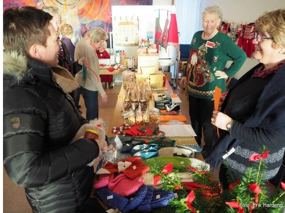
Fra julelørdag i Bakkehaugen kirke

Julemarked ble arrangert i Vestre Akers menighetshus søndag 3.12. og Bakkehaugen lørdag 9.12. Inntektene ble henholdsvis ca. kr 40.000 og drøyt kr 30.000. Det nedlegges stor innsats fra en utvidet gruppe av frivillige i tiden fram mot disse arrangementene, mange arbeidstimer og mye hygge for de som deltar. Vi håper på fortsatt engasjement for disse tradisjonsrike arrangementene og det solide økonomiske bidrag disse utgjør til menighetsarbeidet!