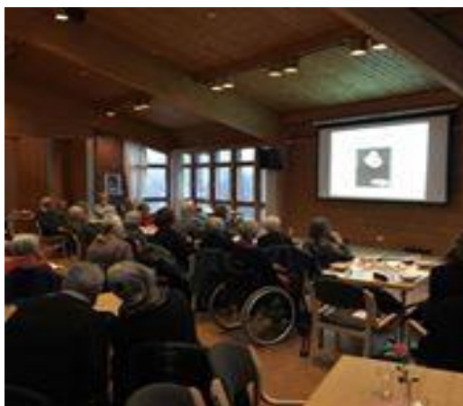
Mandagskveld i Vestre Aker menighetshus