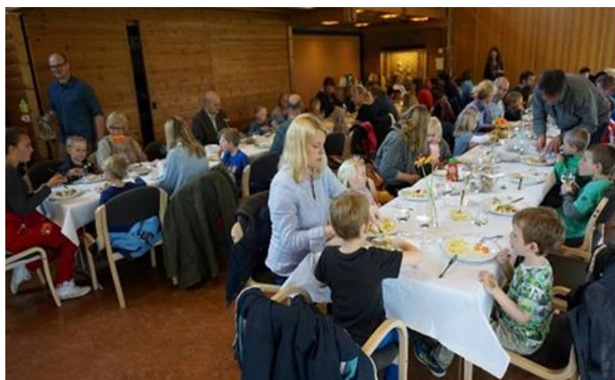
Superonsdag i Vestre Aker menighetshus