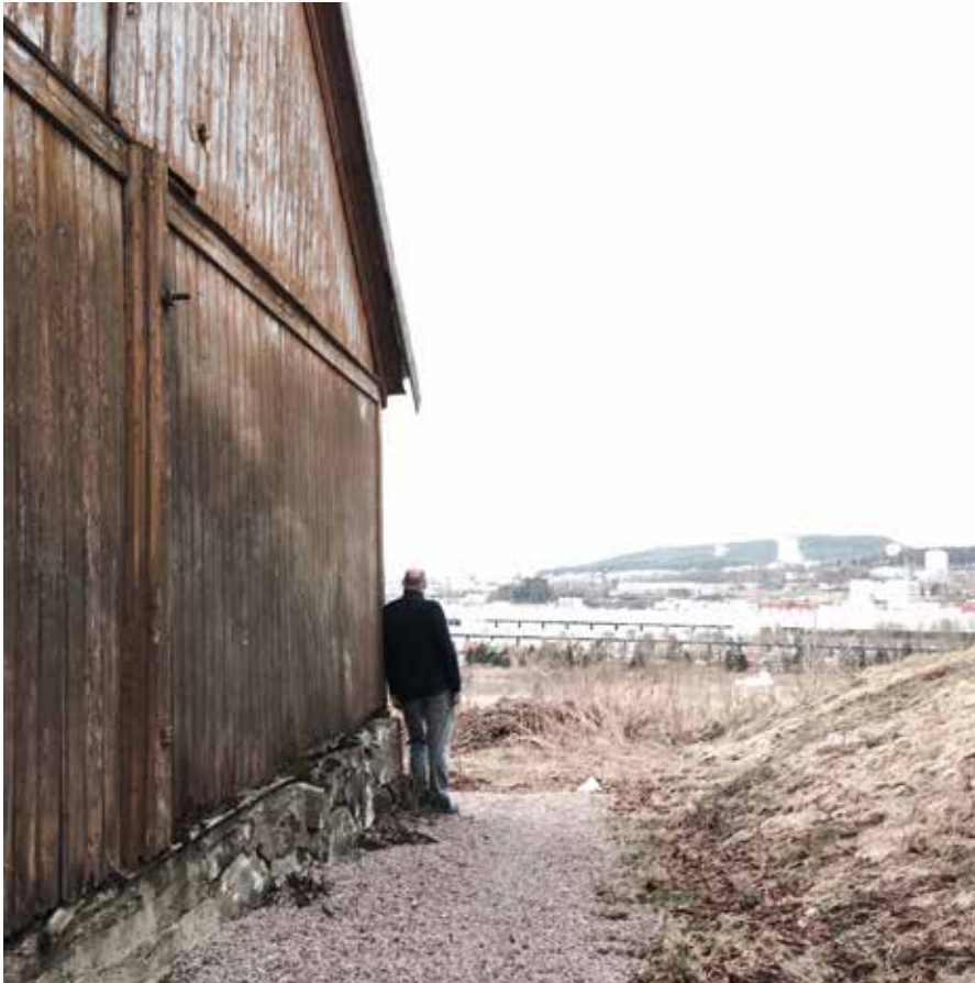
Det endelige vinnerbildet fra «Mobilfotografene»