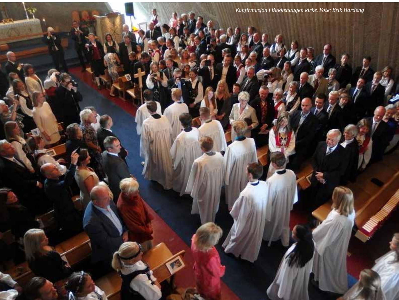
Konfirmasjon i Bakkehaugen kirke.

Norsk konfirmasjon står i en sammenheng av tradisjon, familie og slekt. Dette kan være en av grunnene til at konfirmantopplevelsen i Norge ikke fører til store holdningsendringer: I begynnelsen av konfirmantåret oppgir 46% av konfirmanter at de tror på Gud; på slutten av året er det også 46%. Slik er det ikke i alle land: I Finland og Sverige med sterk tradisjon for lang