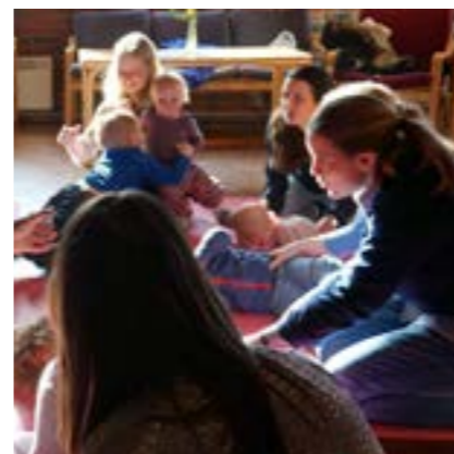
Småbarnssang under Superonsdag

Vestre Aker har samarbeidsavtale med Det Norske Misjonsselskap om prosjektet «Fokus Thailand: Budskap – Bistand». Prosjektet fokuserer på barn og utdanning i slummen og kirkelig undervisning i regi av Den evangelisk-lutherske kirken i Thailand. Prestegårdens misjonsforening er tilknyttet NMS, og støtter opp om menighetens