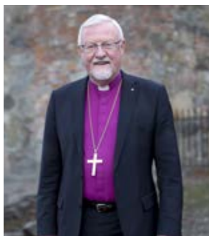
Biskop Kvarme kommer på Tro- og tankekveld 18. september.