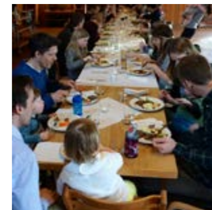
Superonsdag i menighetshuset