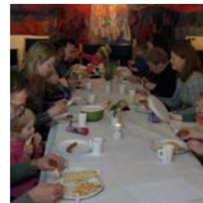
Supermandag i Bakkehaugen

Bakkehaugen støtter et misjonsprosjekt drevet av Det Norske Misjonsselskap med fokus på evangelisering og menighetsbygging i Kamerun. Prosjektet gir blant annet støtte til barne- og ungdomsarbeid og til en preste- og bibelskole. Det er kollekt til misjonsprosjektet flere ganger i løpet av året.