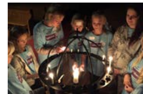
LysVåken i Vestre Aker 2.-3. desember