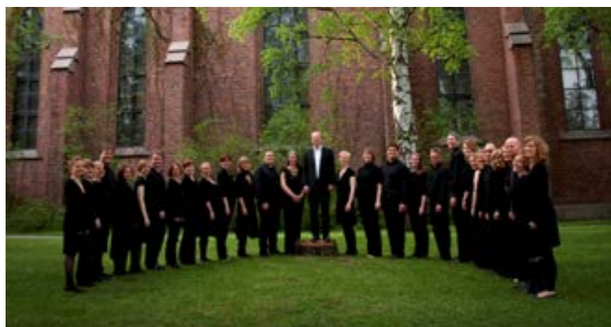
Vestre Aker kammerkor

Utleie av kirkerommet skjer etter særskilte regler med søknad på epost til menighetskontorets adresse. Post.bmv.oslo@kirken.no