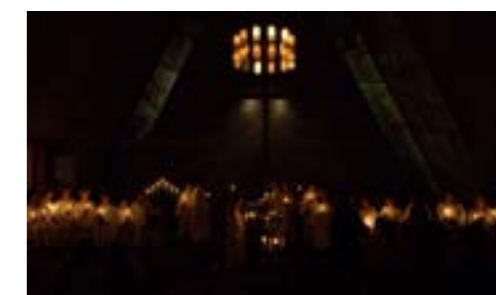
Lysmesse i Bakkehaugen 10. desember