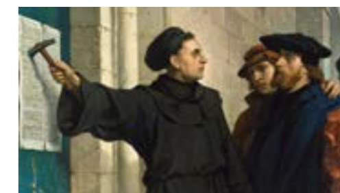
Reformasjonsjubileum i Vestre Aker 29. oktober