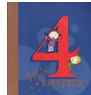
4-årsbok i Bakkehaugen 17. september