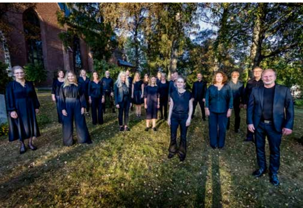
Sprek tredveåring: Vestre Aker kammerkor.

Julekonserten "Hellige Nat" 10. desember kl. 17.00 og 19.30.