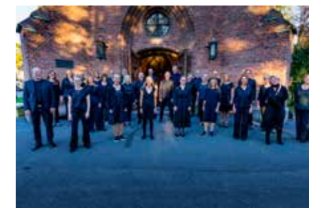
Vestre Aker kammerkor deltar på mange av gudstjenestene.