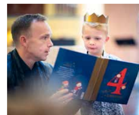
Utdeling av 4-årsbok i Bakkehaugen 15. oktober og i Vestre Aker 22. oktober.