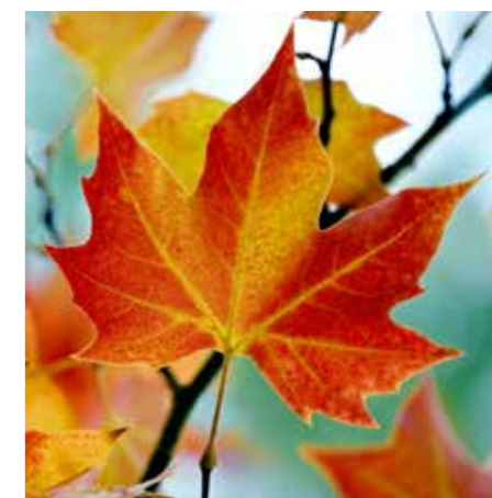
Høsttakkefest i Bakkehaugen 17. september og i Vestre Aker 24. september.