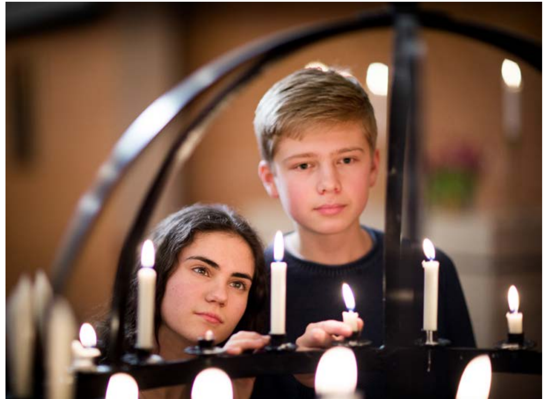
Konfirmanter ved lysgloben i Bekkelaget kirke.

- Det var veldig fint å møte konfirmantene, vi har så