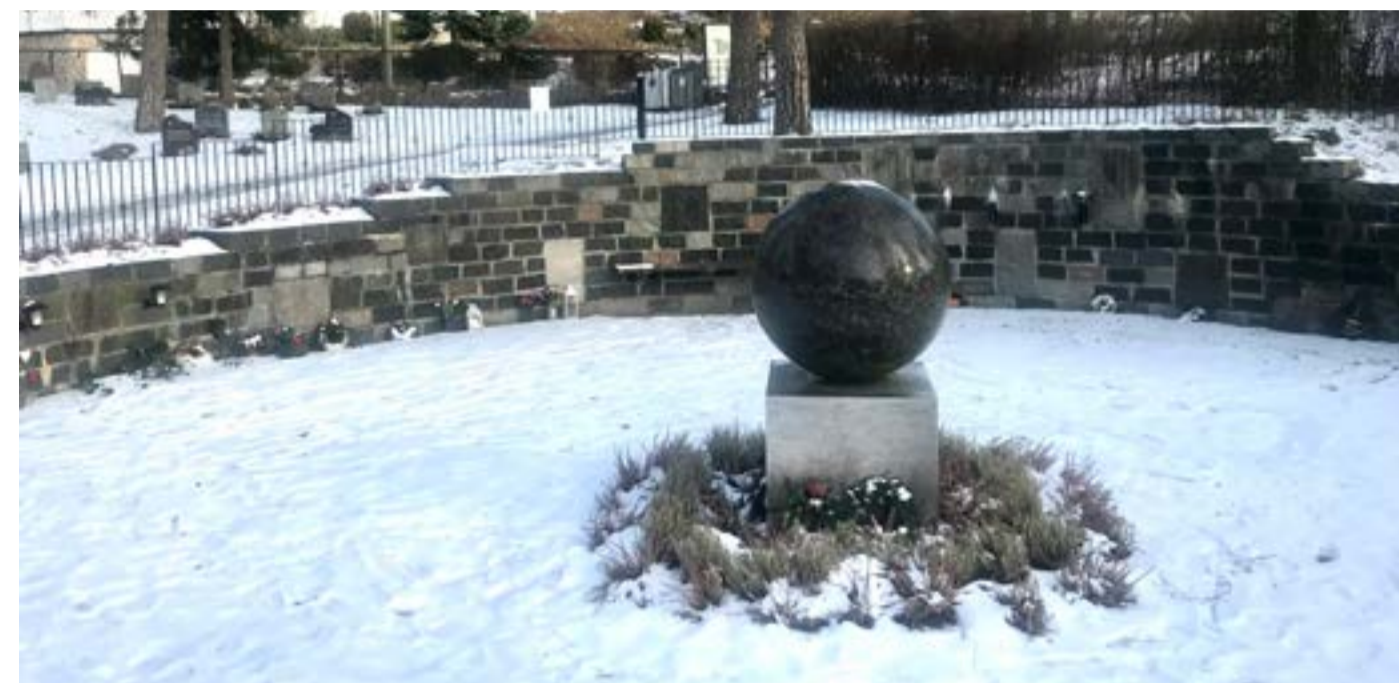
Anonym minnelund på Bekkelaget kirkegård.

For å kunne gravlegges i urnegrav, eller på navnet