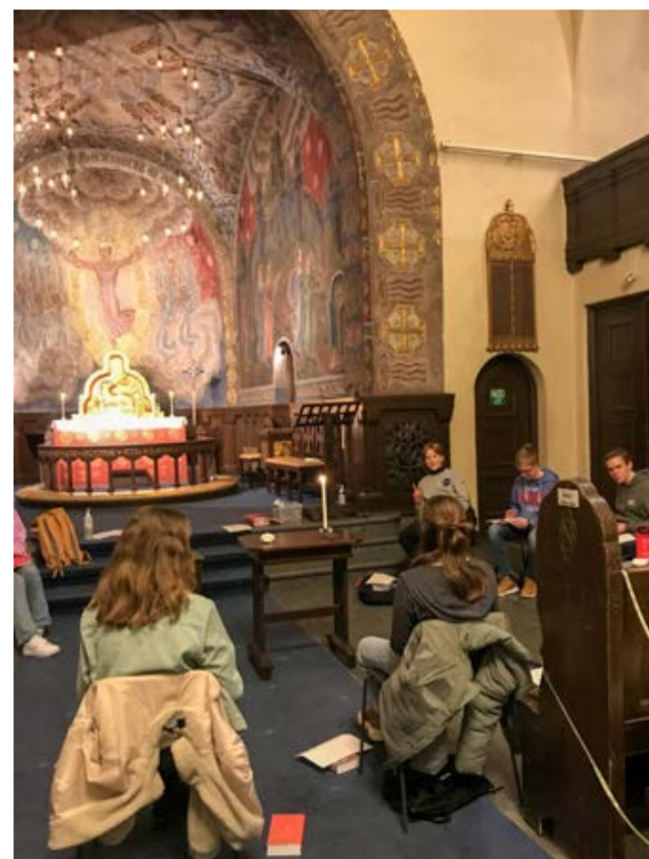
Første undervisningssamling 2021 i Bekkelaget kirke.

mange flotte ungdommer. Alle gruppeledere kunne melde om et svært positivt første møte. Alle konfirmantene møtte også sin gruppeleder til en kort samtale nå i oppstarten hvor de blir litt kjent og snakker om forventninger til året, så flere hadde allerede møttes før sin første gruppesamling.