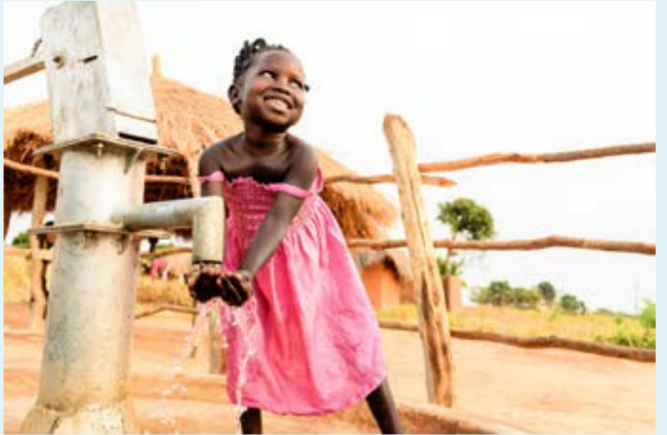
Champo 5 år.

Fasteaksjonen handler om mer enn å samle inn penger. Hvert år settes det også søkelyset på noen av de grunnleggende årsakene til fattigdom og konflikt, og hvordan beslutningstakere i Norge kan gjøre verden mer rettferdig. Vi vet at fattigdom og urettferdighet er menneskeskapt. Det betyr at vi kan bekjempe fattigdom og skape en