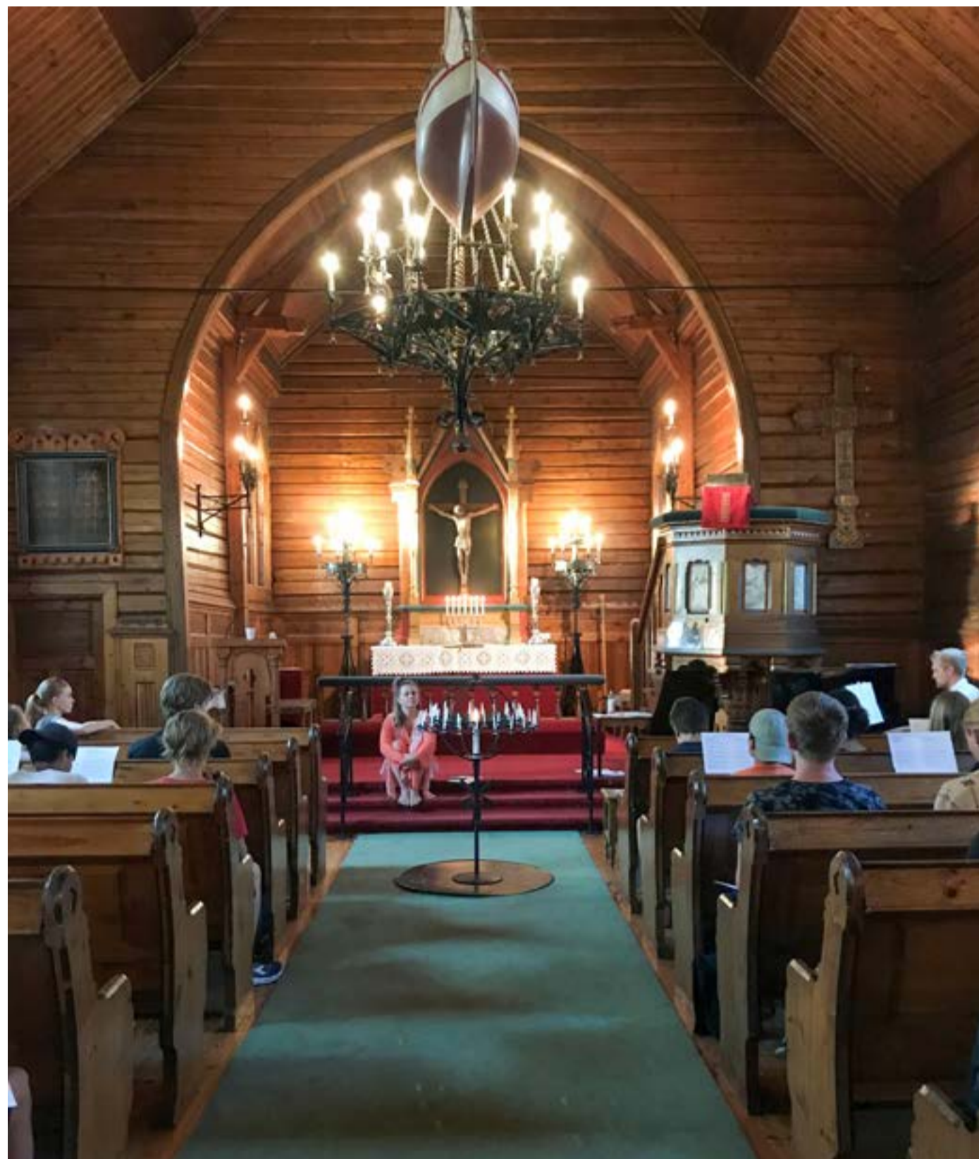
Konfirmantleir i Ormøy kirke i 2020.

med rundt 10 konfirmanter i hver gruppe så det blir lettere å holde god avstand når alle samles.