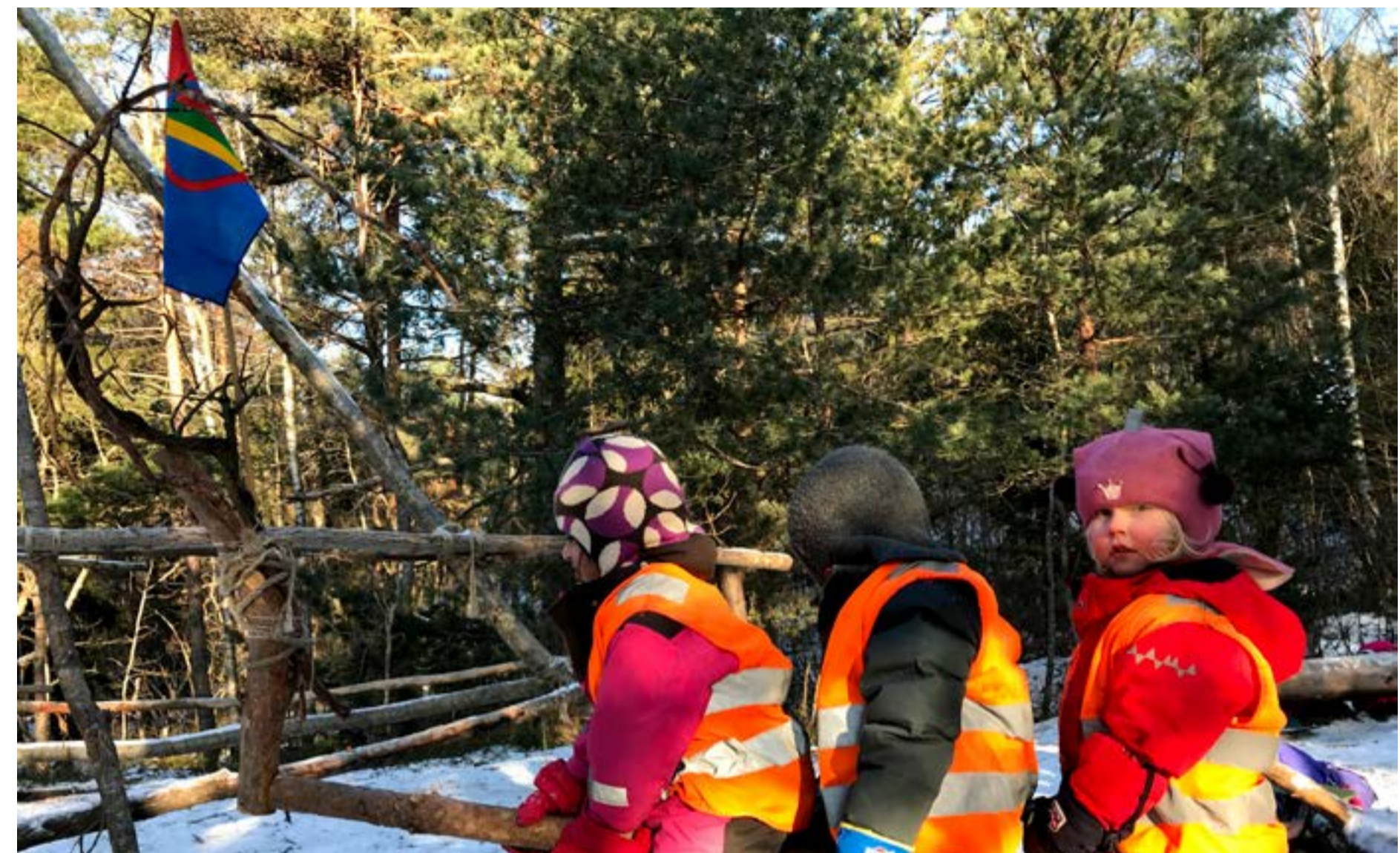
Er det et reinsdyr de har laget?

Tekst: Heidi Moreno