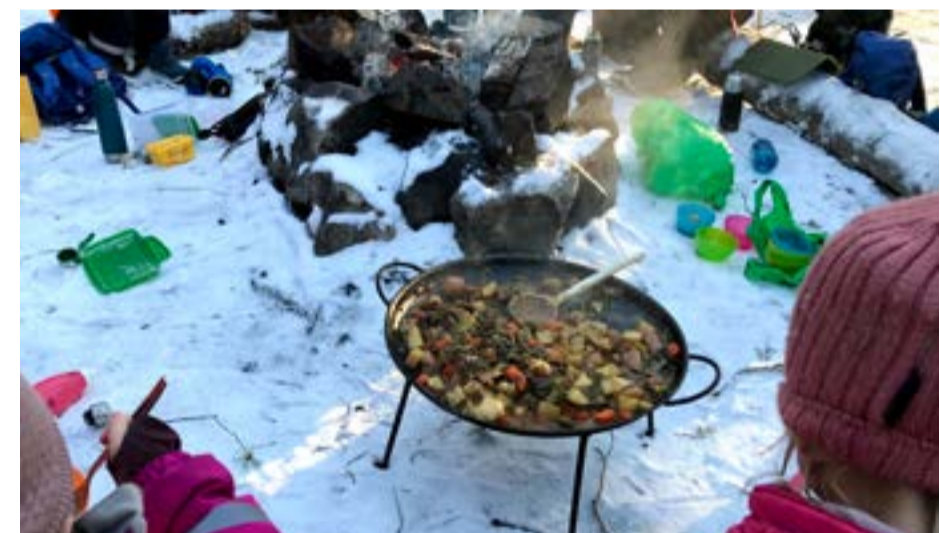
I ring rundt bålpannen.

I år er satsningsområdet i barnehagen «Mangfold og gjensidig respekt». Hele barnehageåret blir preget av dette arbeidet der vi fordyper oss i ulike tema fra den amerikanske urbefolkning til ulike folk og språk til dette tema om samene. Det er fint å se hvordan slike prosjektarbeid fenger barnegruppa.