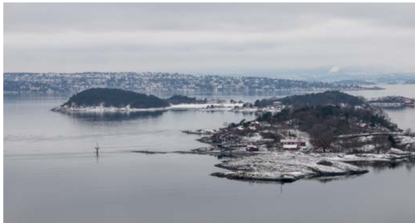
Bildet er tatt på en tur langs Kongsveien, ved Utsikten. Bleikøya er nærmest, bak der er Rambergøya og Gressholmen. Den lange ryggen bak der igjen er Nesodden.

Etter arbeidstid på hjemmekontoret har det blitt mange turer i nærmiljøet. På den måten har jeg «oppdaget»