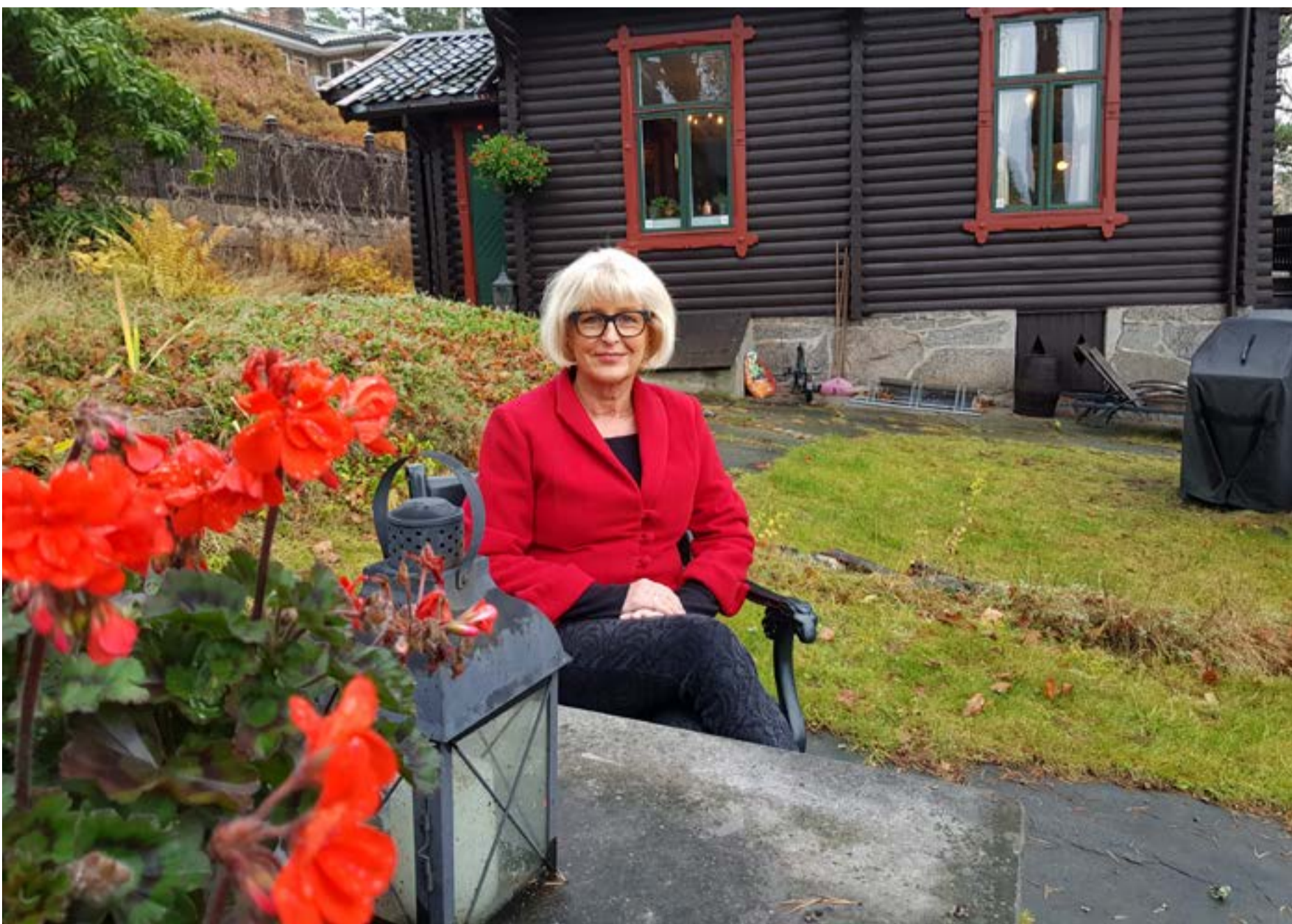
Hjemme er et fint sted å koble av.