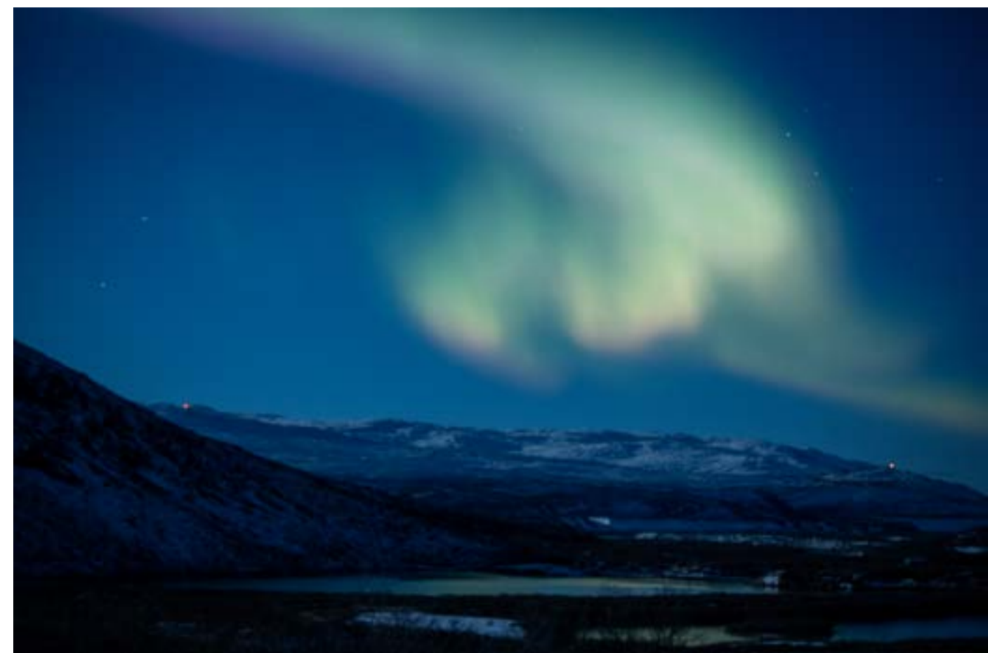
Nordlys i nærheten av Kangerlussuaq.

Den siste utflukten vi var med på var en havsafari langs kysten. Kanskje vi fikk sett en hval eller to. Men nei, de viste seg ikke. Dyrelivet for øvrig holdt seg unna oss, bortsett fra en moskusflokk