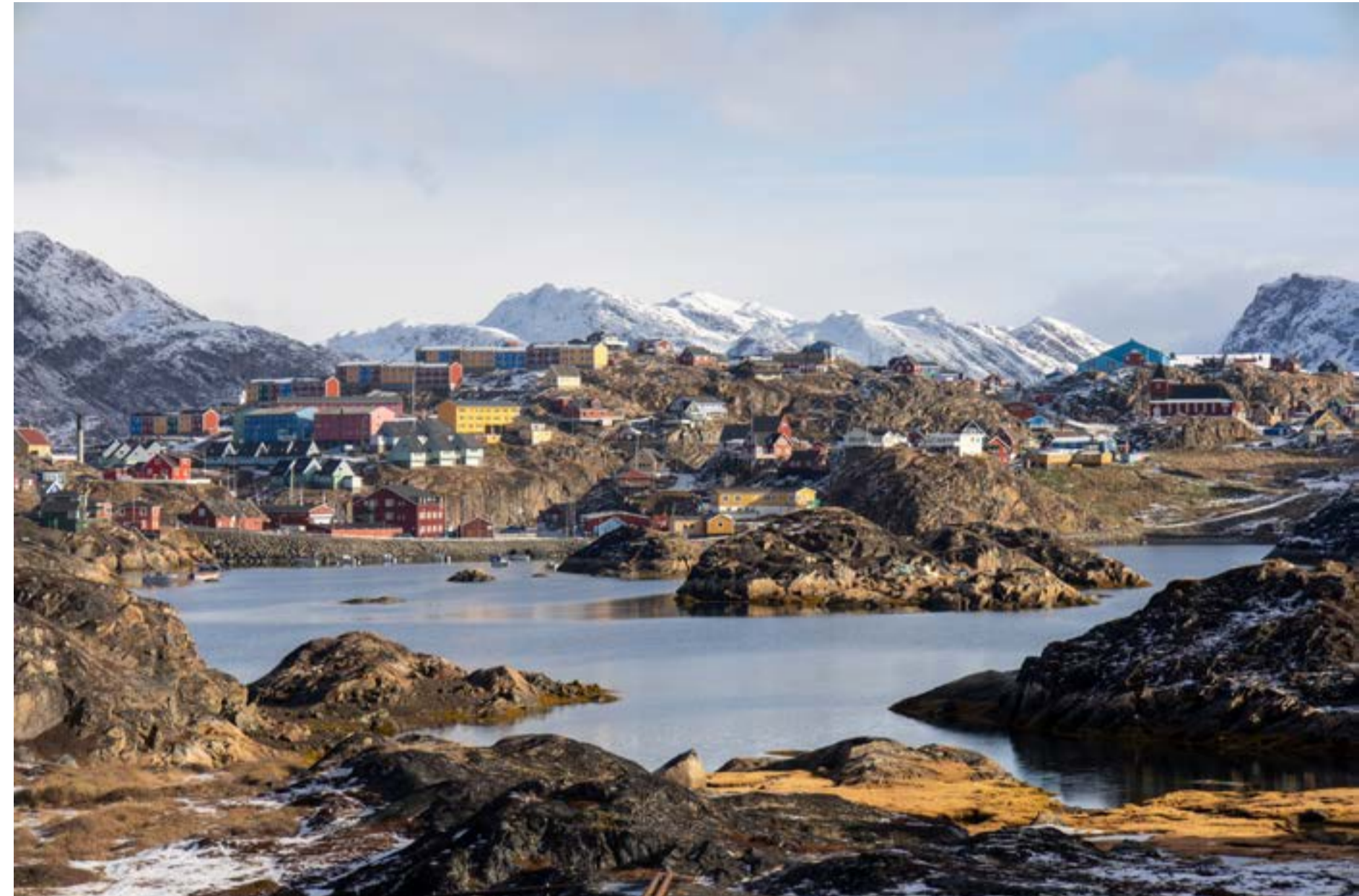
Byen Sisimiut som ligger ved vestkysten av Grønland.

Grønland var påfallende mange bygninger og trapper av tre. Alt trevirke importeres fra Danmark. Grunnmur av betong rett på fjellet var det vanlige her. Store boligblokker var det en del av. Man kan jo tenke seg at de innfødte slet med å tilpasse seg denne boformen i forhold til hvordan de bodde før. Her i Sisimiut var det vanlig med hus lagd av torv i gamle dager.