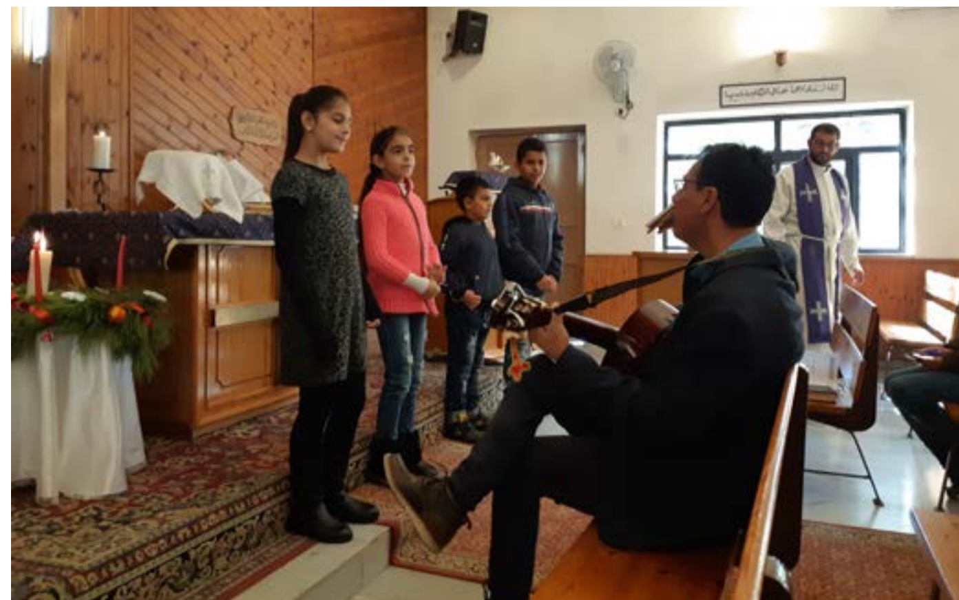
Fra menighetslivet i Beit Sahour.

Hyrdene holdt engang nattevakt over flokken sin og opplevde at merkelige budbærere viste vei til en stall, som ble det fattige leiet for barnet Jesus. Jul er beretning om fred, frihet og glede midt i det fattigslige og enkle. Vårt vennsapsarbeid vil forene oss i ulike land om tro på julens budskap, håpet om fred og tjeneste for hverandre.