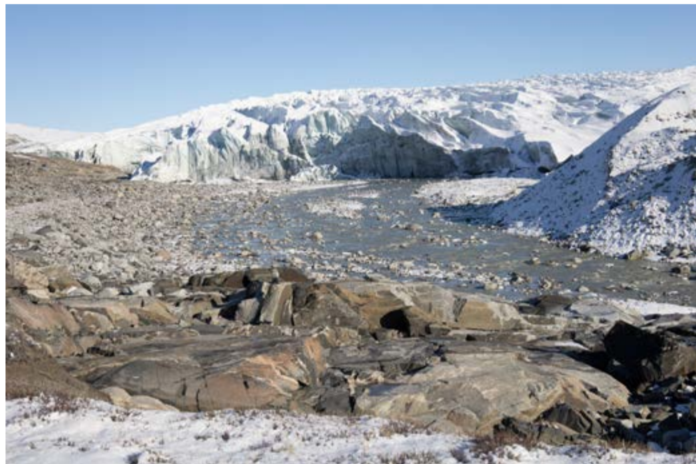
Russell-breen, en utstikker fra innlandsisen.

Det var US Air Force som under 2. verdenskrig etablerte en militærbase i Kangerlussuaq. Hele byen med flyplass, bolighus og andre bygninger og veinett er bygd opp av amerikanerne. I 1992 overtok Danmark/Grønland alt sammen for 1 dollar. På veiskiltene går det derfor både på