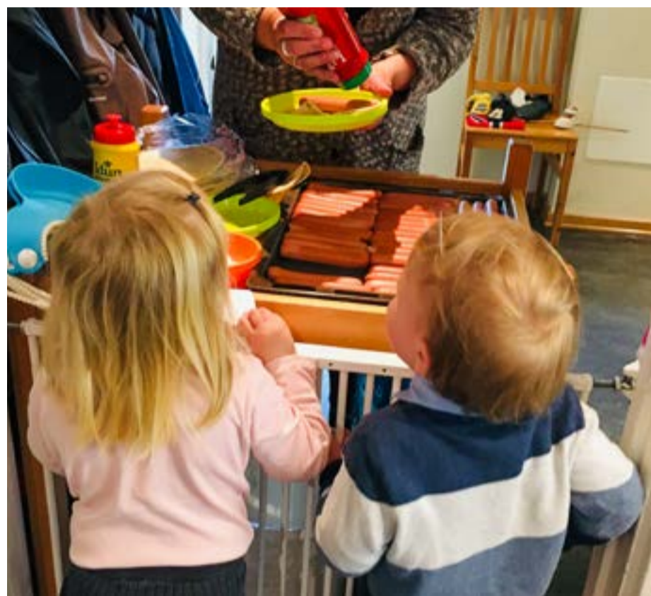
Her venter noen på pølser.

restriksjoner, og vi er alle enige om at det er supert å ha et eget lite tog og en enkel feiring med lek og moro, sang og hurrarop i fokus.