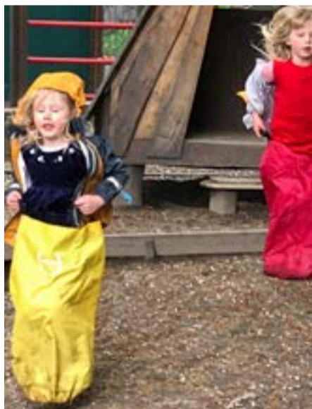
Sekkeløp med full innsats.

Mandag 17. mai regnet det ustoppelig, så da var det ekstra hyggelig at solen tittet frem dagen etter da det var barnehagens tur til å feire «Norges bursdag». Barna møtte pyntet og fine opp i barnehagen og alle hadde med norske flagg. Barnehagen er nå på gult nivå. Det betyr at hver avdeling er én kohort. Vi laget derfor vårt eget tog der vi gikk avdelingsvis og med Maxi-gruppen, dvs. skolestarterne i