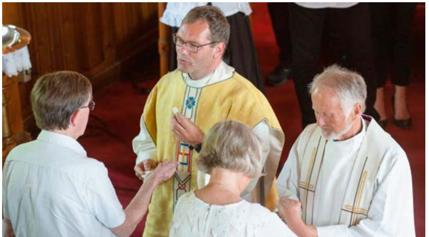
I den justerte gudstjenesteordningen er blant annet nattverdens utdelingsord forandret.

I mange år har det ikke vært lagt opp til kunngjøringer i gudstjenestene. Nå åpnes det for dette igjen. Det er ønskelig å begrense mengden av