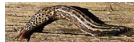
Leopardsnegle