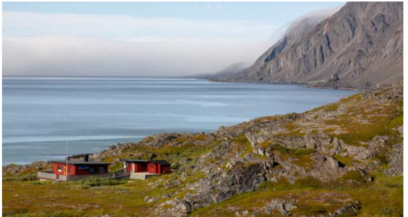
På veien mellom Mehamn og Gamvik i Finnmark.

Dette jaget etter vår mening om alt mulig går igjen mange andre