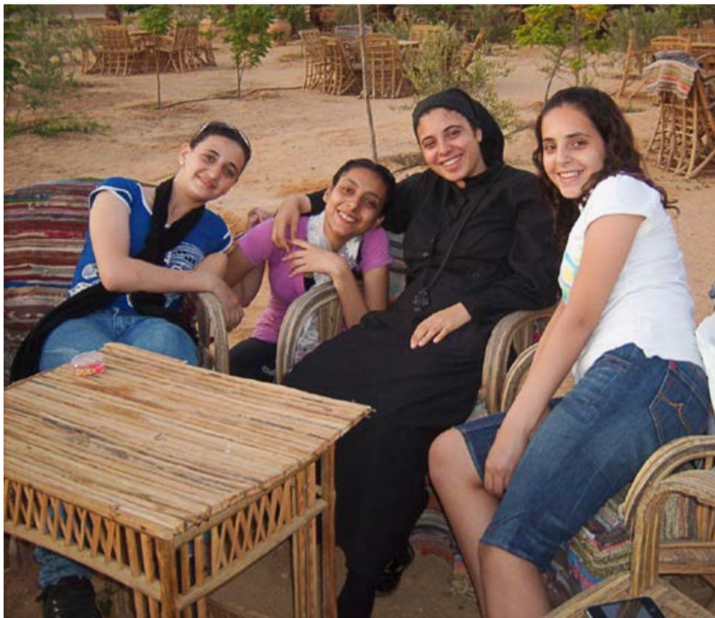
Noen av jentene på Anafora.

På Anafora ligger Anastasia, skolesenteret som vi støtter. De siste årene har det blitt lagt vekt på undervisning for kvinner. I Egypt