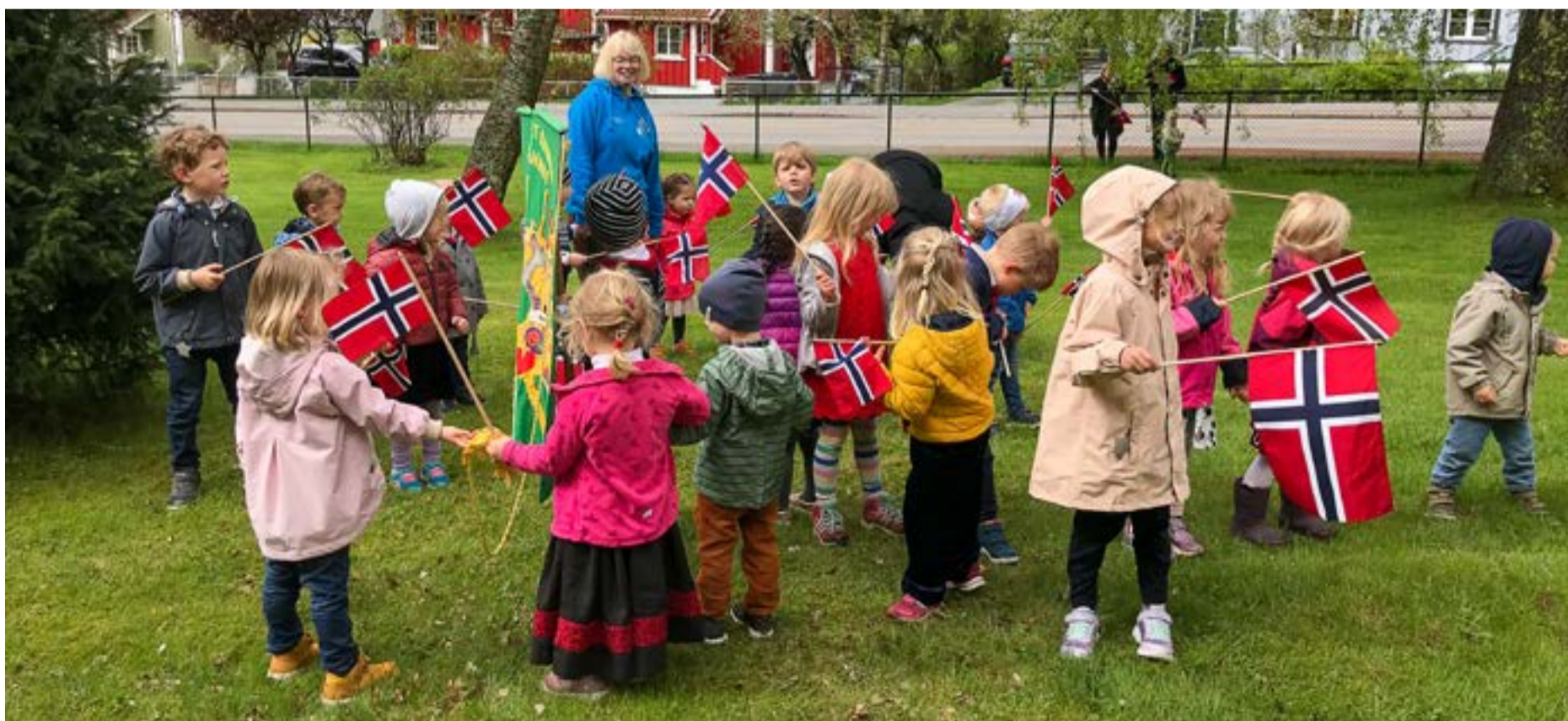
Barnehagebarna klare med norske flagg.