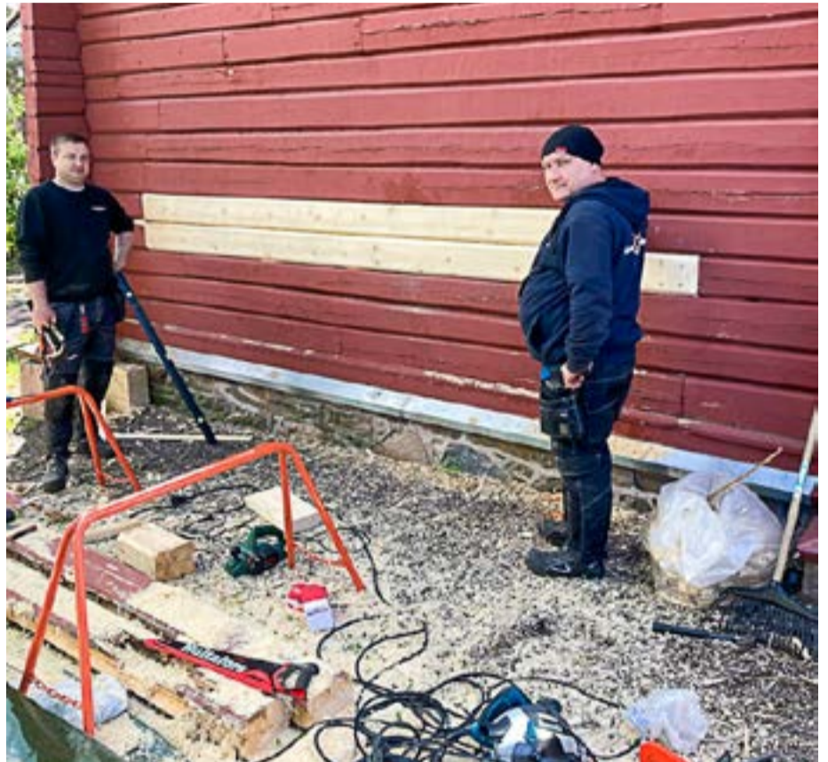
Utskifting av råteskadede bjelker i kirken.

Vi trenger fortsatt økonomisk støtte fra beboere og institusjoner i området og alle som setter pris på en unik trekirke i hovedstaden. Kontonummeret er 1607.43.64784. Vi takker for alle bidrag vi har fått til prosjektet!