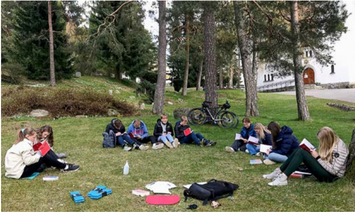
Konfirmantundervisning utenfor Bekkelaget kirke.

Noe som virkelig må framheves er konfirmantenes fantastiske innsats under årets Fasteaksjon. Vi kunne jo ikke gå på dørene