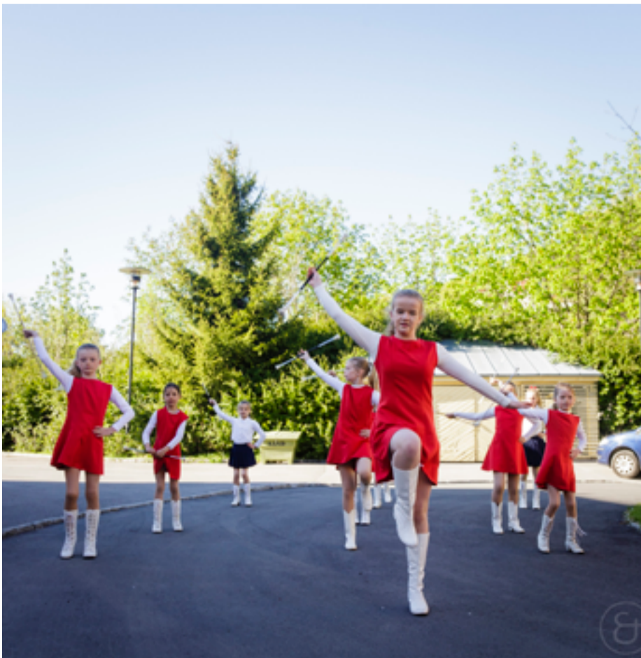
Drillgjengen viser frem kunster for publikum på musikalsk sommerfest.

Midten av oktober - nabolagskonsert i gymsalen på Nedre Bekkelaget skole. 1. søndag i advent - julekonsert i Ormøy kirke.