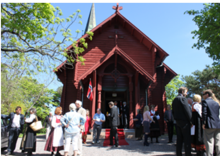
Ormøy kirke 120 år.

Ormøy kirke ble innviet mai 1893 og er den eneste laftede kirken i Oslo.