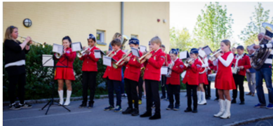
Korpset varmer opp publikum på musikalsk sommerfest.