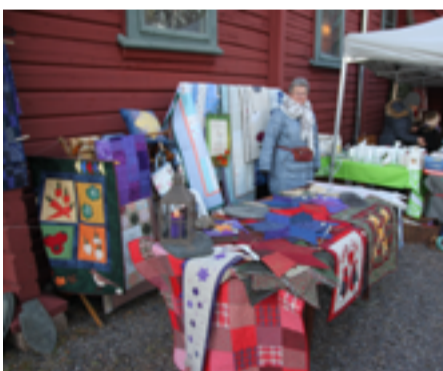
Fra julemessen 1. advent 2013.