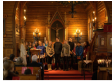
Presentasjon av konfirmantkullet 2014.