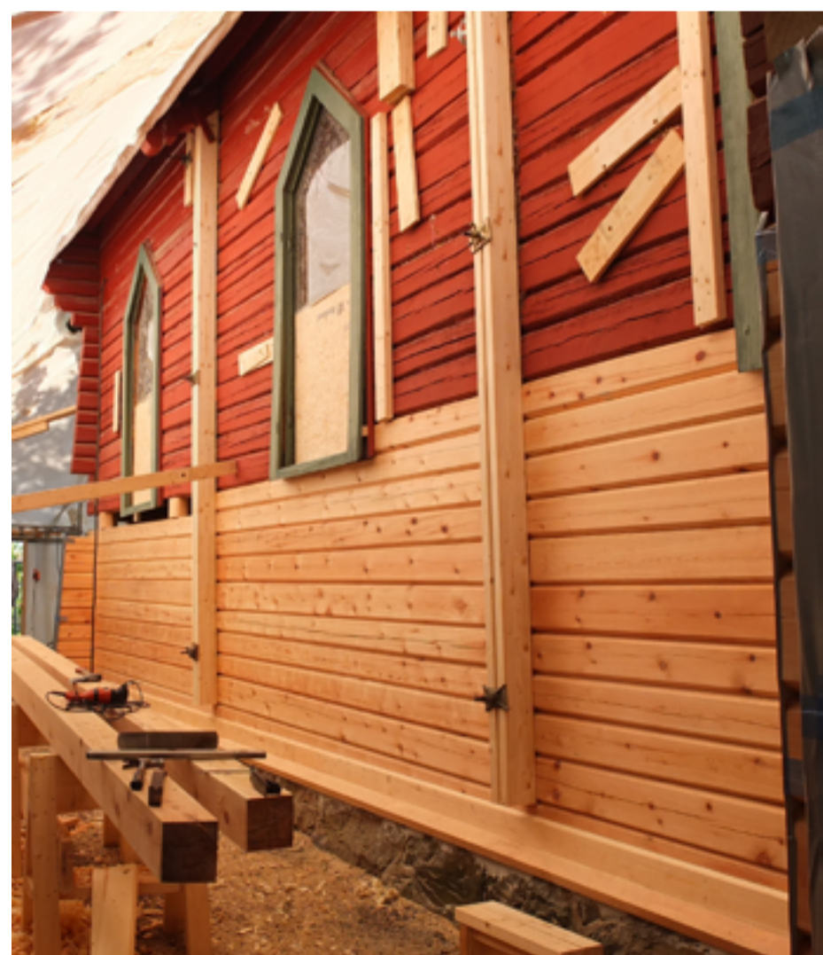
Slik så den ene, utvendige siden av kirken ut under arbeidet.