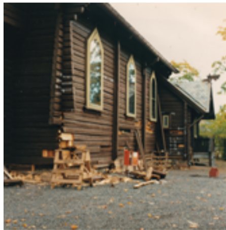
Sydfasaden under rehabilitering høsten 1990.