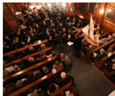
Lions julekonsert med Oslo Politiorkester.