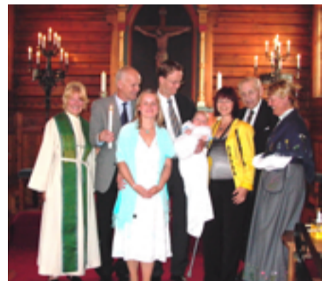
Ormøy kirke er en populær kirke for dåp. Oktober 2005.