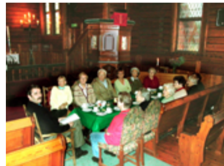
Formiddagstreff i Ormøy kirke november 2005.