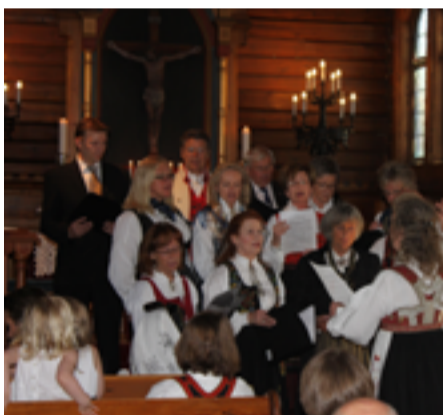
Voksenkoret Bølgebrus synger under en jubileumsgudstjeneste (Ormøy kirke 120 år).