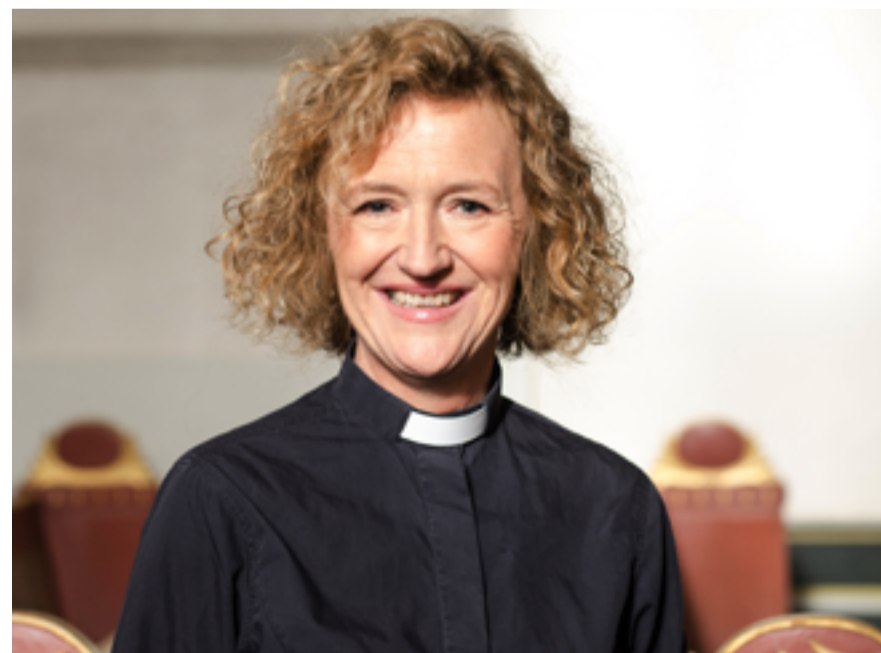
Kari Veiteberg, biskop i Oslo bispedømme.