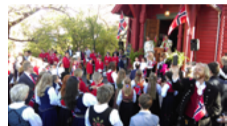
17. mai 2016 på kirketrappen.