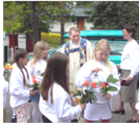
Daværende biskop Gunnar Stålsett og noen barn fra barnekoret under bispebesøket 2. mai 2004.