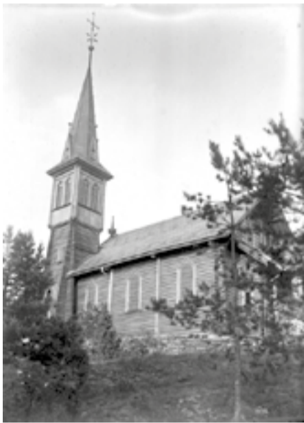
Ormøy kirke ca år 1900.

Vi har satt sammen en bildekavalkade over en del av historien til kirken opp gjennom årene. Det er alt fra rehabilitering, bispebesøk og konfirmantkull til karnevalsgudstjenester.