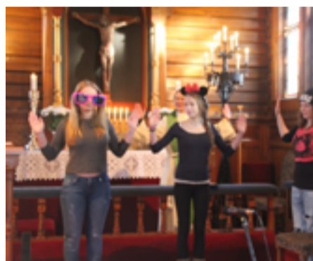
Karnevalsgudstjeneste 8. februar 2015.