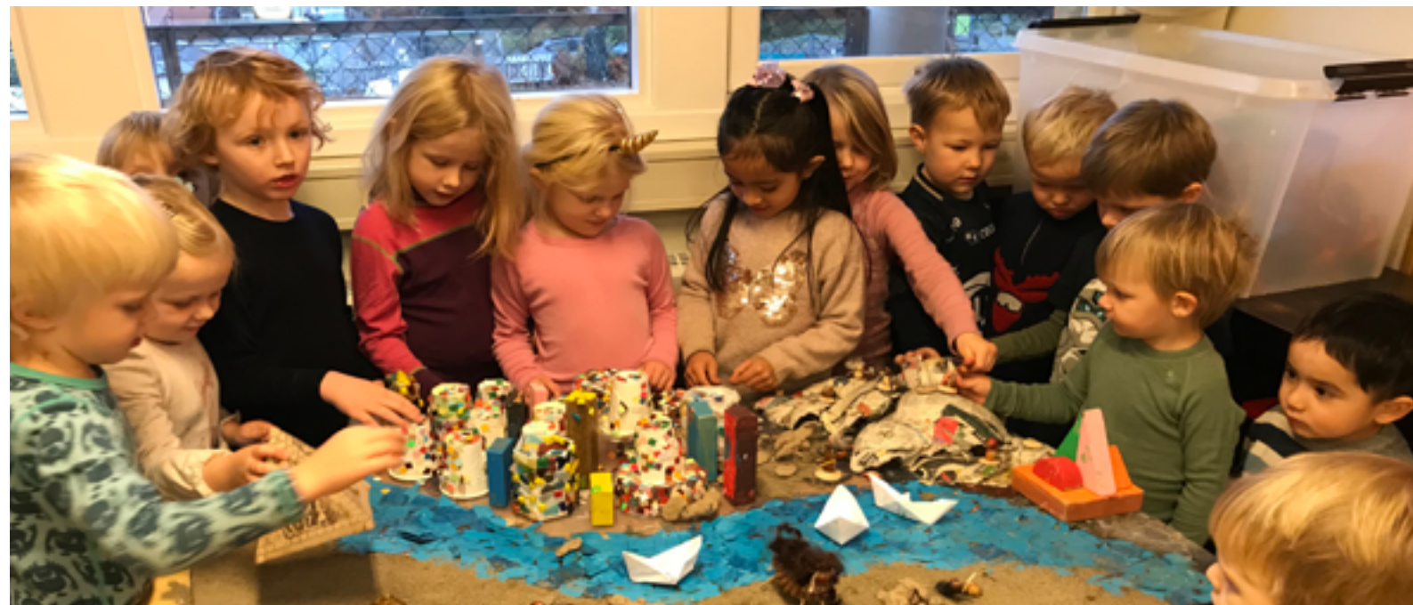
Barnehagebarna har laget en modell av Kairo.