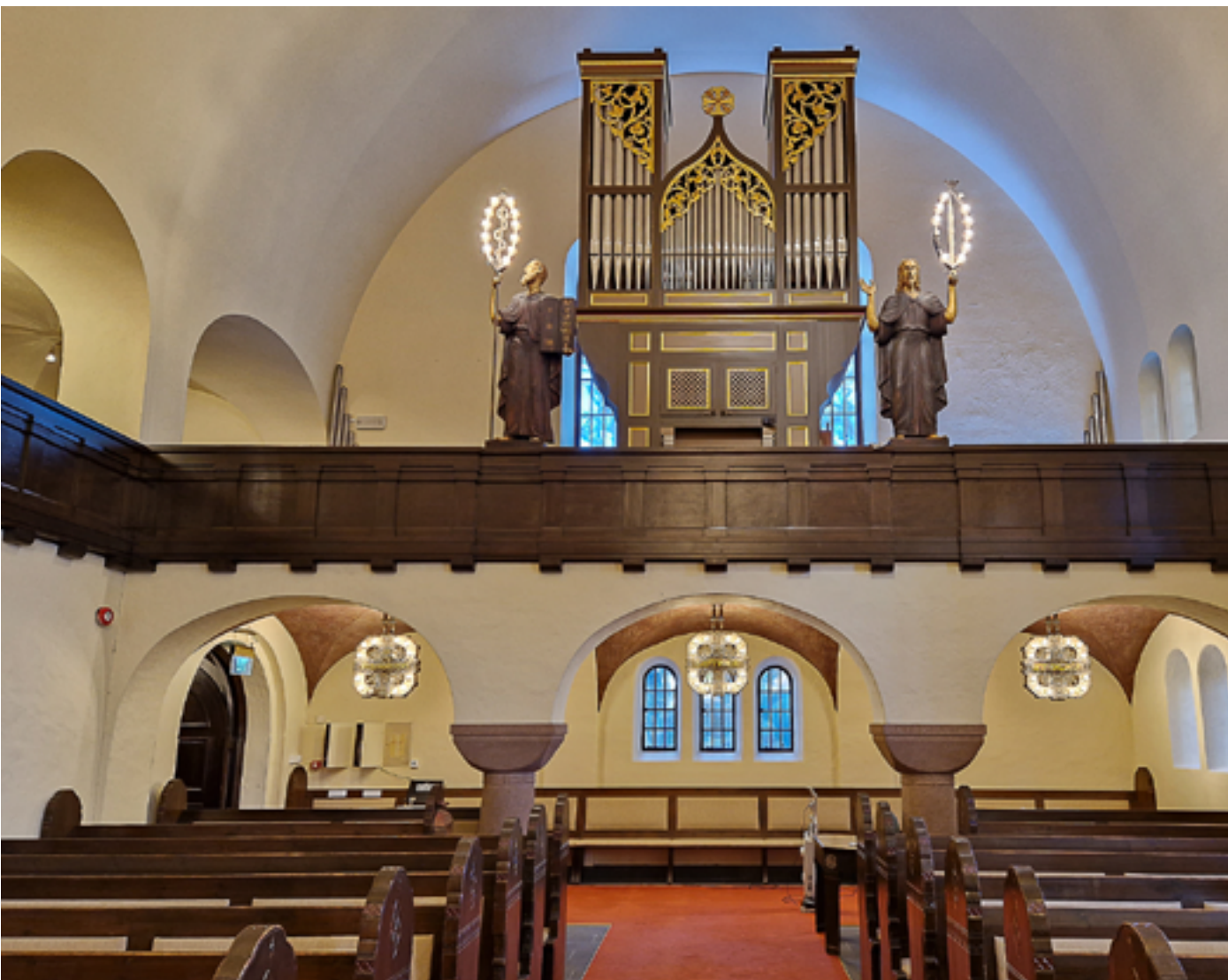
Bakre del av kirkerommet med orgel på galleriet.