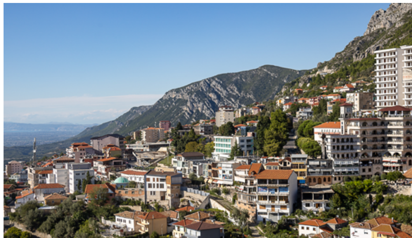
Byen Kruja oppe i fjellene var Albanias gamle hovedstad. Foto: Jan Brekke.

Nå er det helt annerledes. Albania er et vestlig orientert land under rask utvikling, og turismen har blitt viktig. Det kunne vi selv se med 4-5 stjerners hotellkomplekser i de større byene langs kysten. Men selv om det går framover, er det mye etterslep som skal tas igjen. Albania er fortsatt Europas nest fattigste land, etter Moldova. Det er stor forskjell på by og land. Levestandarden er mye høyere