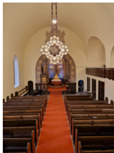
Selve kirkerommet framstår slik etter oppussingen, med bl.a. rødt gulvteppe, nytt skifergulv og vannbåren varme i gulvet.