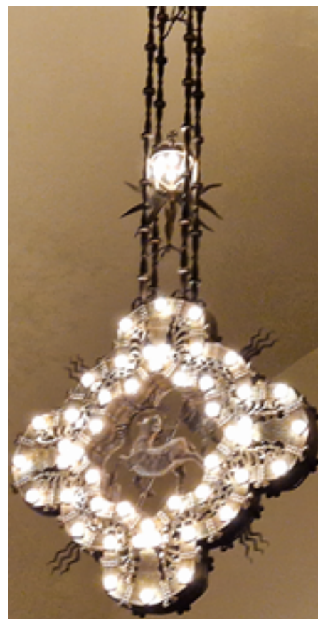
Lysekronen som henger fra taket.