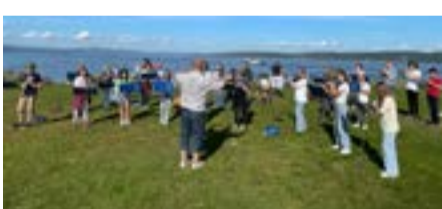
Fra en øvingshelg i august.

Bekkelaget Skoles Musikkorps er et korps for barn og unge fra ca tre klasse til 19 år. Vi tar opp nye medlemmer fra Bekkelaget og Kastellet skoler hver høst - alle er velkomne. Man trenger ikke forkunnskaper, og man får utdelt instrument. Korpsset er delt i tre etter alder og erfaring: Aspirantkorps, juniorkorps og hovedkorps.