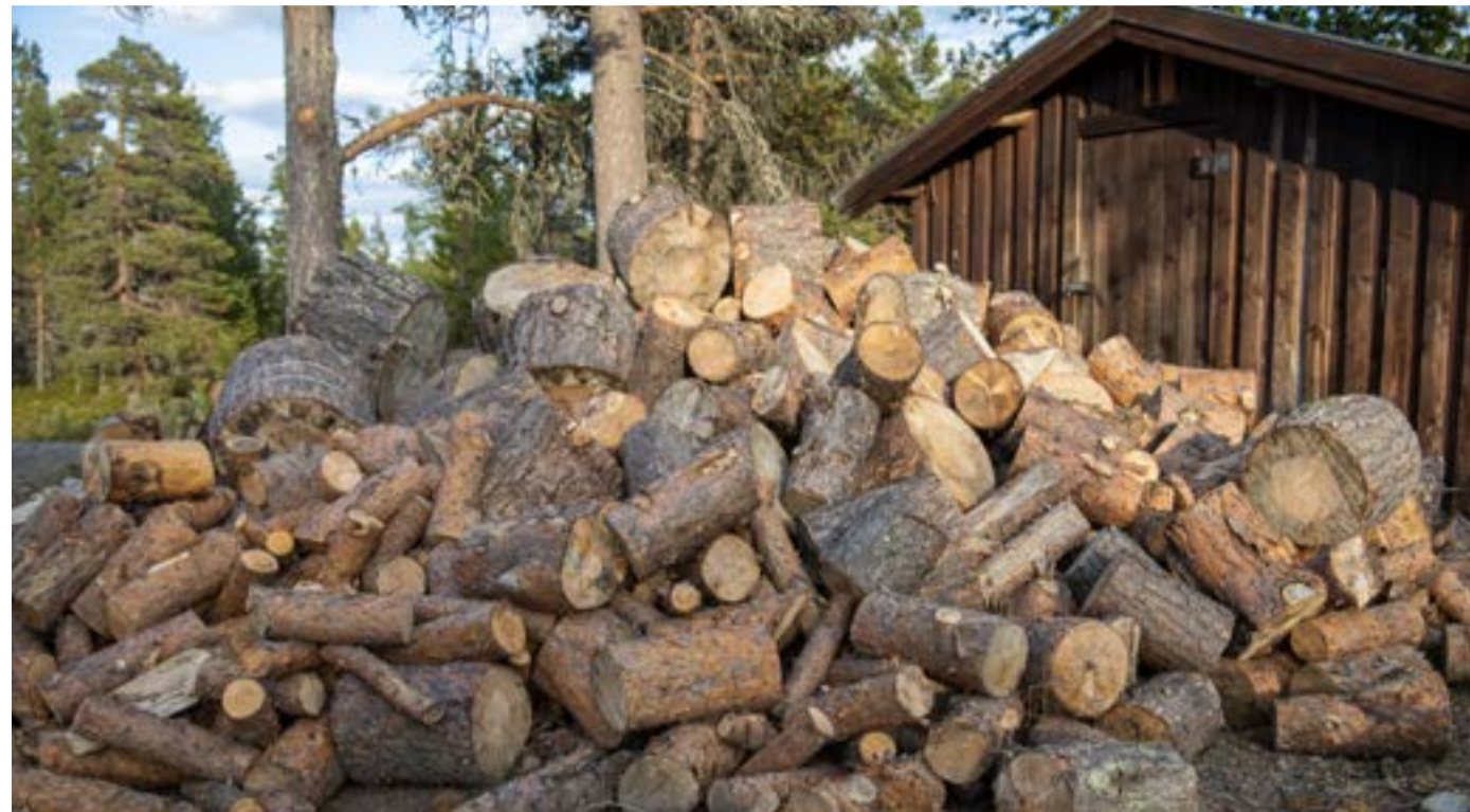
Vedhaug på hytta.

Vi måtte nok bruke kroppen mer før hvis snakker om de vanlige gjøremålene i løpet av en vanlig dag. Så det at vi med tiden har fått avlastning for de tyngste