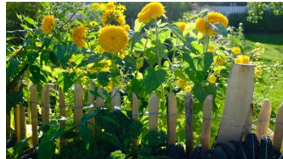
Fyllt solsikke ved navn "double sanking".

Tips: Blomsterhagen på Abildso Vårtreff Botanisk hage i mai. Her kan man få kjøpt både stauder, sommerblomster og urter.