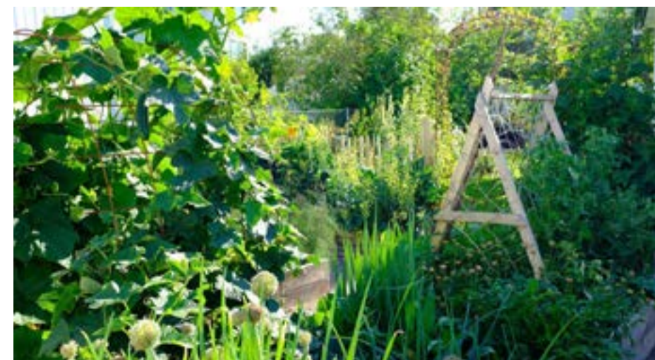
Som i Edens hage?