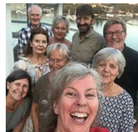
Glade sangere i Ormøy.

Liker du å synge? Bølgebrus er et romslig lite kor som øver i Villa