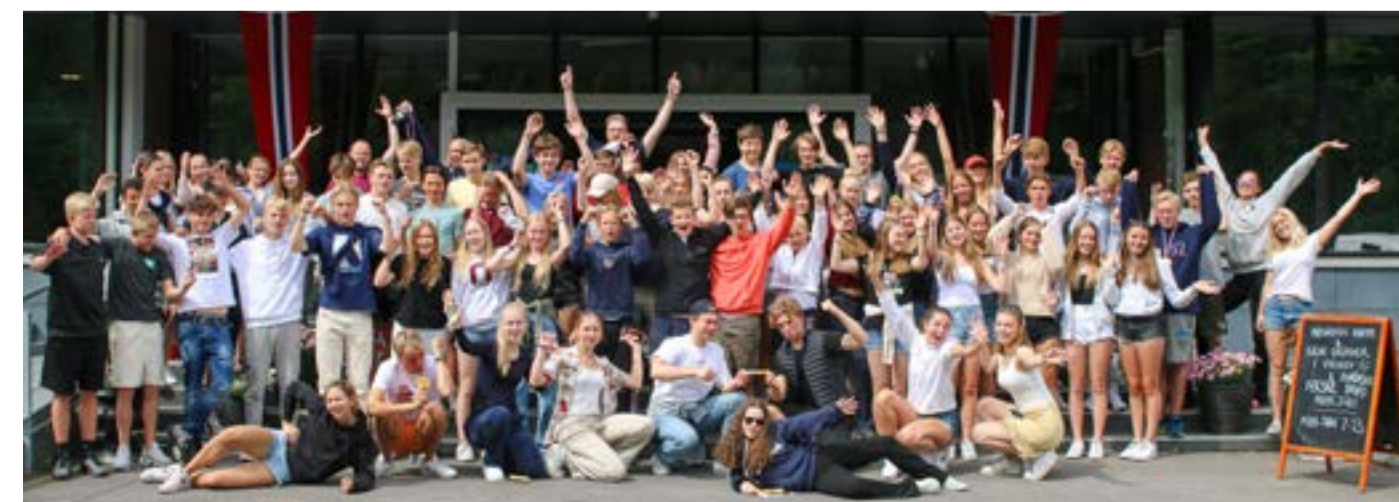
Fra de to konfirmantleirene på Rønningen Folkehøyskole.