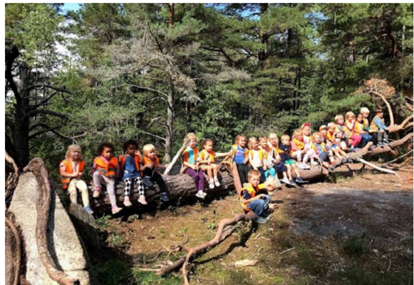
Regnbuen i skogen.

Vi bygger benker og etablerer bålplasser. Vi gleder oss til vi kan begynne å tenne bål for da kan vi lage maten vår på rist eller wok over bålet; fiskekaker med pita, gryteretter eller taco. Alt smaker mye bedre ute i det fri! På leirplassen vår hører vi eventyr. Favoritten er «Gutten som kappåt med trollet». Etter eventyrstund er det gøy for barna å leke eventyret.