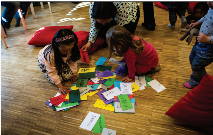
Familiekornedlemmer gjør seg klar til «Navnesangen» som er en del av det faste repertoaret på Bølengen.