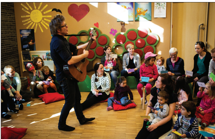
Tron med gitaren sin leder an sangen i familiekoret Bølengen.