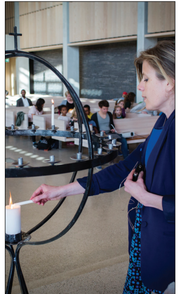
Erle prest tenner lys på fellessamlingen i kirkerommet kl. 17.30.