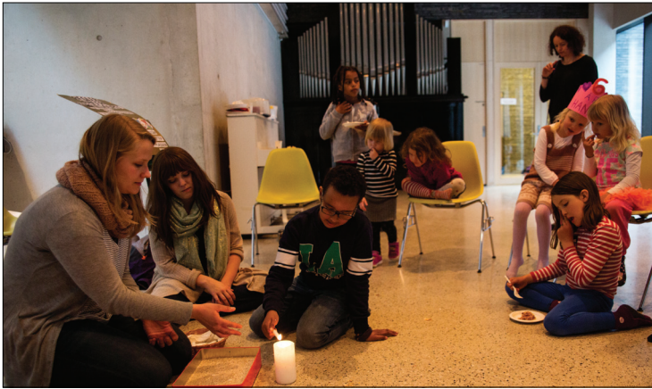
Fast på barnegospel er en samling med lystenning og høytlesning.