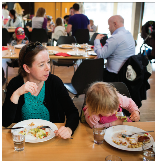
Stortorsdag starter med middag kl. 16.45 til kl. 17.30. Rundt 60 barn og voksne spiser middag i konfirmantsalen.

Hverdagsmiddag. Bølingen. Barnegospel. Sportyklubb. Annenhver torsdag er det storfamiledag i Bøler kirke. Da myldrer det av liv og aktiviteter i hele bygget. Den dagen kaller vi stortorsdag.