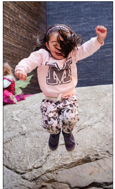
Det er alltid litt tid for løp og lek for barn med «Spring i beina». I det åpne rommet mellom konfirmantsal og barnekapell er det fint å leke.