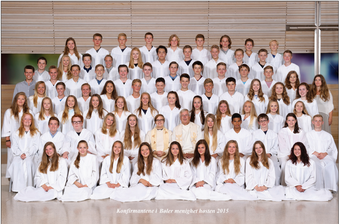
Konfirmantene i Bøler menighet høsten 2015