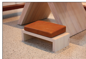
Bøneskammelen som står plassert bak alteret