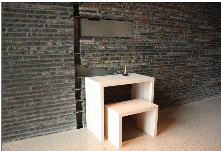
Bønnebordet og bøneskammelen som står i sidekapellet i kirkerommet