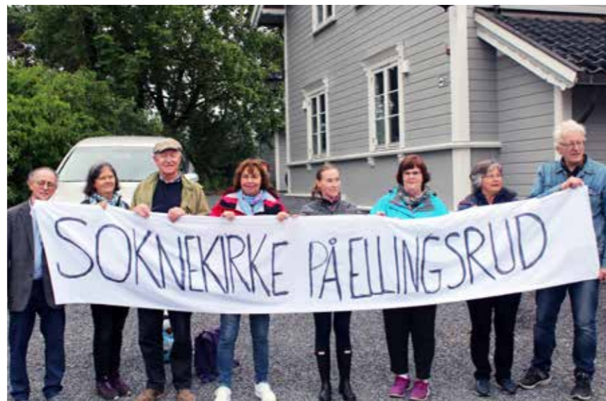
Demonstrasjon utenfor møtet i Oslo kirkelige felleråd 13. juni 2019. På møtet ble det vedtatt å fristille Ellingsrud kirke for utleie til kirkes bymisjon, men dette vedtaket er nå omgjort.