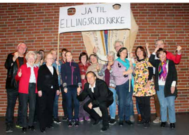
Kamplysten er stor. Markering på folkemøte Ellingsrud kirke 23. oktober 2018.