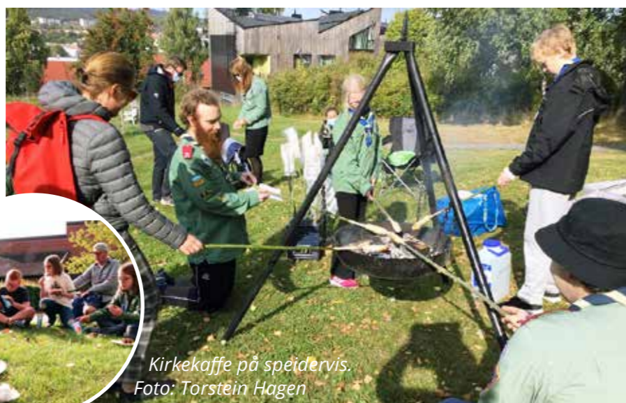
Kirkekaffe på speidervis.

Speiderne på Furuset har alltid vært knyttet til kirken, sier Hirsch, og vært en viktig del av kirkens barne- og ungdomsarbeid. Derfor er det naturlig at vi også kan være med på familiegudstjenester når det arrangeres. En viktig del av et speidermøte er også at vi avslutter møtet med å syng speiderbønnen sammen. Og selv om dette er et arbeid med kristens fortegn, opplever