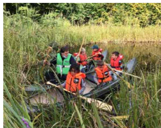
Padling på Furusethavet.

Speiderjubileet gikk av stabelen søndag 20. september med en jubileumsgudstjeneste og mange aktiviteter uten-dørs etterpå. Slik kunne arrangementet som skulle ha gått av stabelen i april gjennomføres likevel. Litt mindre enn først planlagt, men med nødvendige smitteverntiltak på plass for en trygg.