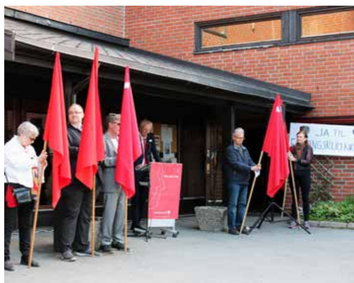
1.mai 2019 med markering utenfor Ellingsrud kirke.