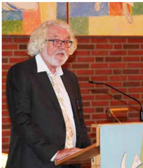
Forfatter Edvard Hoem bidrog med appell og opplesning fra en av bøkene sine på folkemøtet i Ellingsrud kirke for bevaring av kirkene i Groruddalen, 28. august 2018.

Tekst: Bjarne Hjeltnes