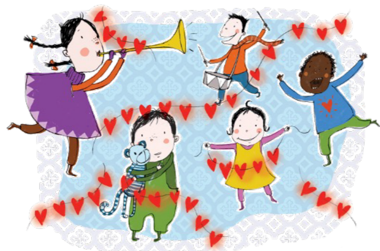
Illustrasjon: Eila K. Okstad