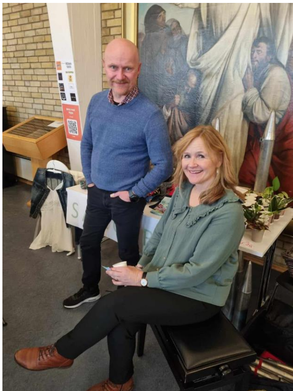
Organist og ektefelle ved salgsboden på Hasle synger.

Det er blitt tradisjon at konfirmantene våre får en liten orgelpipe i gave fra Hasle menighet på konfirmasjonsdagen.