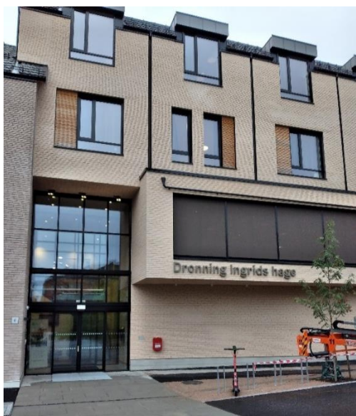
Inngangsparti Dronning Ingrid's.