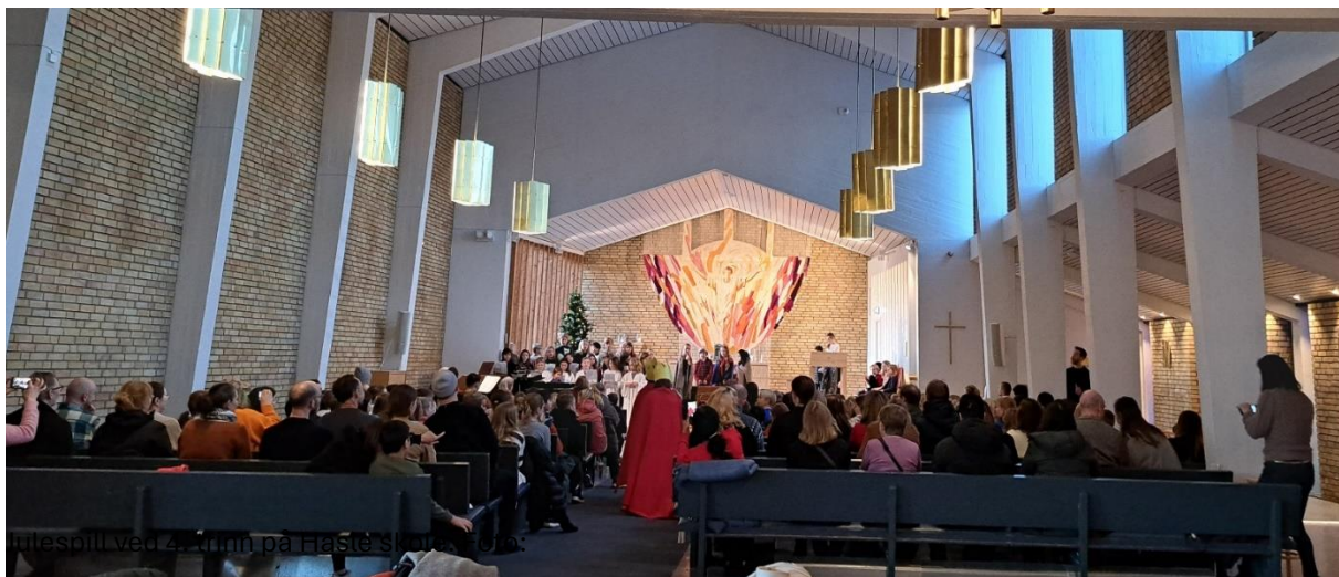
Julespill ved 4. trinn på Hasle skole.

I 2023 tildelte regjeringen Den norske kirke et ekstra tilskudd som skulle brukes til å hjelpe personer og barnefamilier som ble særlig påvirket av økte priser og renter. Hasle sokn søkte om kr. 30.000, - og fikk tildelt kr. 15.000, -. I samarbeid med Hasle skole ble det utarbeidet en tekst som ble sendt ut via et meldingssystem, Skolemelding, som Osloskolen bruker. Flere personer i nærmiljøet donerte og penger til prosjektet, slik at alle som søkte fikk økonomisk støtte. Dette ble meget godt tatt imot i lokalmiljøet, og menighetsrådet har gjort et vedtak på å gjenta dette i 2024 gitt, at det også dette året kommer en ekstra økonomisk tildeling fra regjeringen.