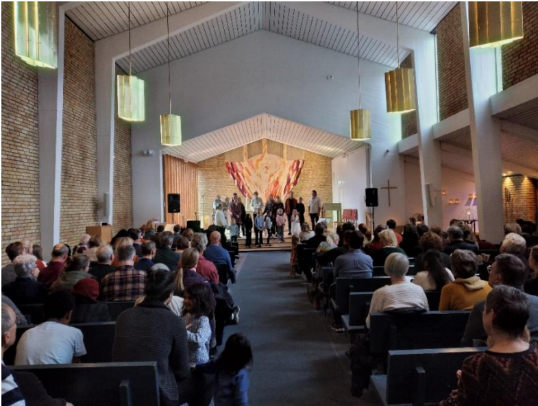
Hasle synger 29. oktober 2023.