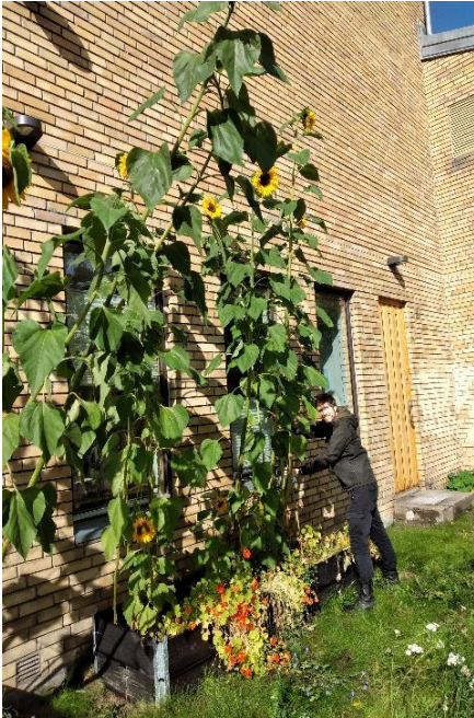
Daglig leder med solsikker.

Hasle kirke har en liten hagegruppe, bestående av daglig leder (på bildet), Petra (frivillig), og diakon. Petra og diakon følger i hovedsak opp fra mai til oktober, setter nye blomsterløk før frosten kommer om høsten, direktesåing av sommerblomster og solsikker i mai, utplanting av søndagsskolens store solsikker som ble plantet innendørs i april/mai (se bildet!), og noe lusing i august/september. Daglig leder bidrar med innkjøp, lusing, vanning og plantefaglige råd.