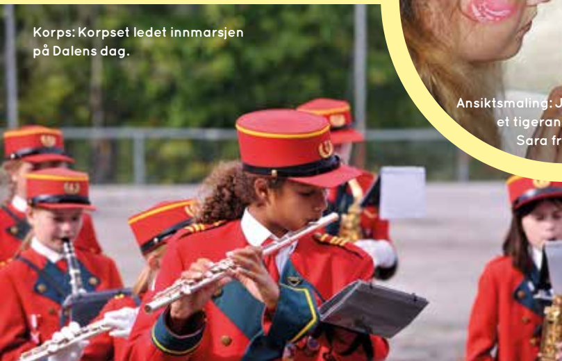
Korps: Korpsset ledet innmarsjen på Dalens dag.