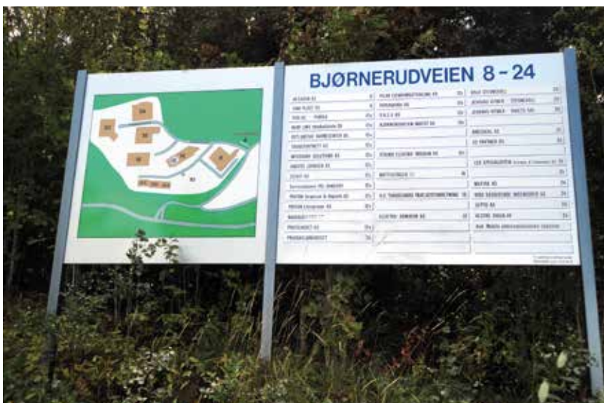
Oversiktstavle med virksomhetene som har tilhold på sørsiden av Bjørnerudveien. Den viser er høyst variert blanding av aktiviteter.