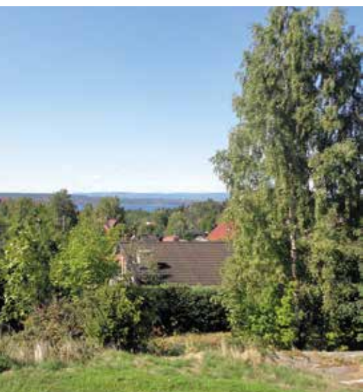
Utsikten mot Bunnefjorden fra det høyeste punktet på Rugdeberget borettslags område.