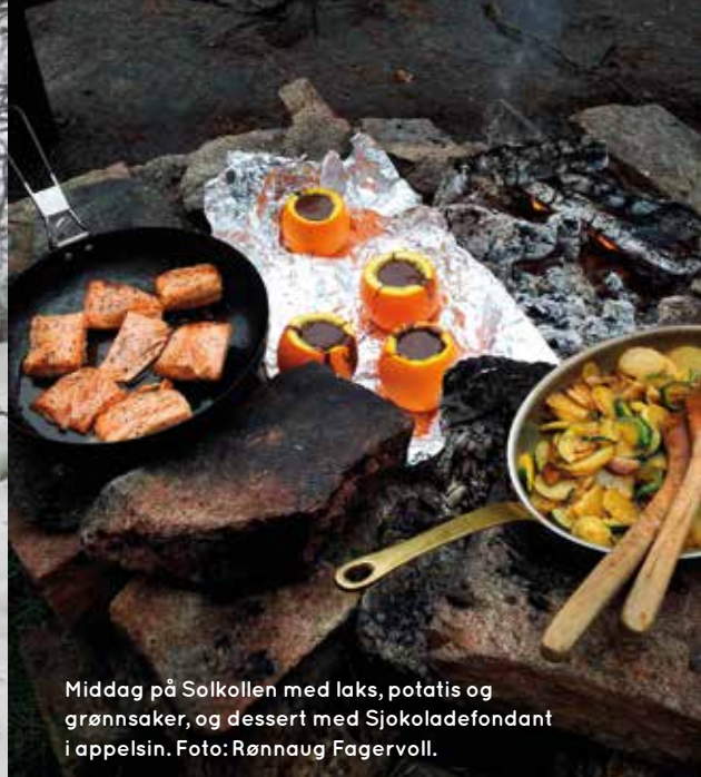
Middag på Solkollen med laks, potatis og grønnsaker, og dessert med Sjokoladefondant i appelsin.