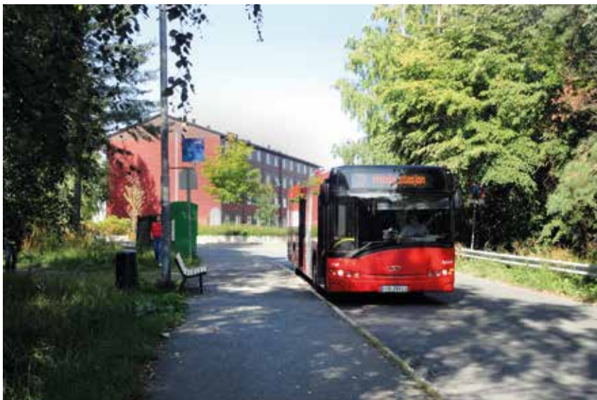
I bakgrunnen ser vi snuplassen øverst i Bjørnerudveien, i forgrunnen buss nr. 77 som nettopp har rundet snuplassen.