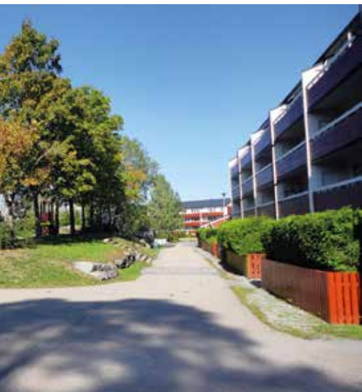
Bebyggelsen lengst sør i Rugdeberget borettslag.