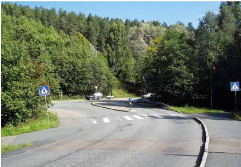
Krysset Bjørnerudveien/Ljabruveien. Ljabruveien ses i bakgrunnen. Fra krysset fører Bjørnerudveien opp til snuplassen mellom Nebbejordet og Rugdeberget.