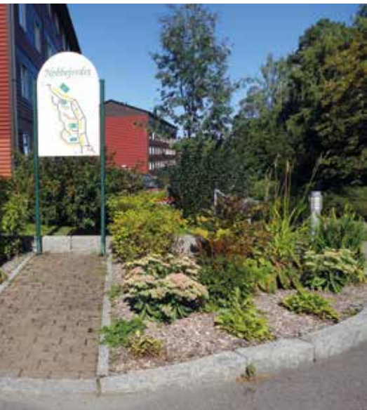
Inngangen til Nebbejordet borettslag sett fra snuplassen øverst i Bjørnerudveien.