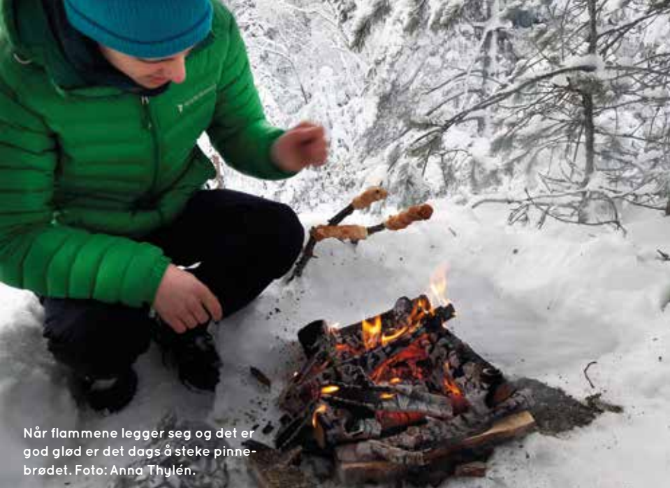
Når flammene legger seg og det er god glød er det dags å steke pinnebrødet.