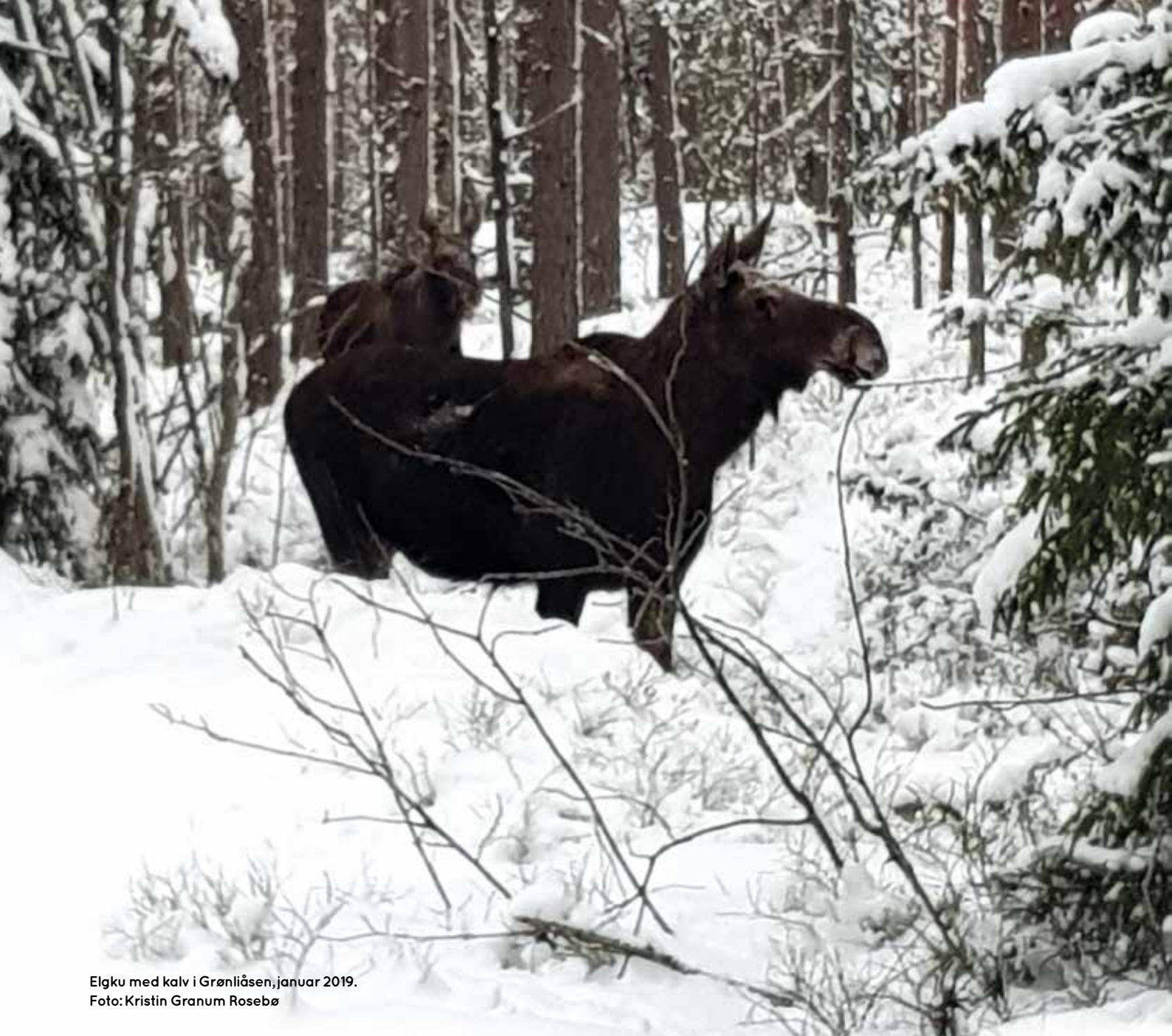
Elgku med kalv i Grønliåsen, januar 2019.