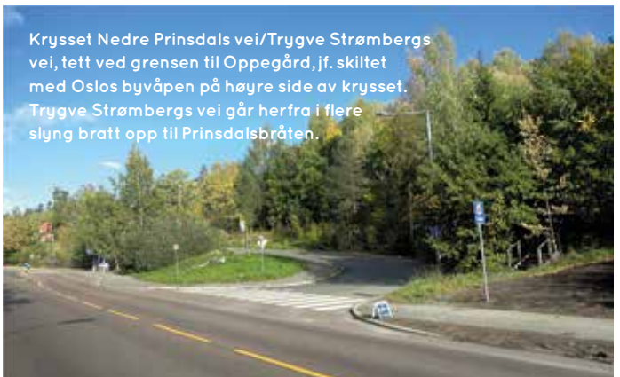
Krysset Nedre Prinsdals vei/Trygve Strømbergs vei, tett ved grensen til Oppegård, jf. skiltet med Oslos byvåpen på høyre side av krysset. Trygve Strømbergs vei går herfra i flere slyng bratt opp til Prinsdalsbråten.

til Toppåsen der den krysser Toppåsveien. Høgåsveien fører videre ned til Liakollveien som går langs jernbanelinjen på vestsiden av Toppåsen. Tidligere førte Høgåsveien helt ned til jernbanelinjen der den gikk i undergang ved den daværende Holmlia stasjon og videre frem til den daværende Holmliveien. Dette siste stykket er i dag en lite brukt gangvei.