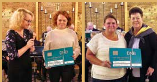
Glede representanter for skolekor og korps mottar jubileumsgavene.