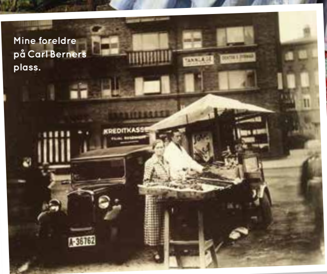
Mine foreldre på Carl Berners plass.

Det koster å drive et leirsted som i dag rommer 80 barn og unge.