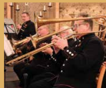
Hornister på gamle instrumenter.