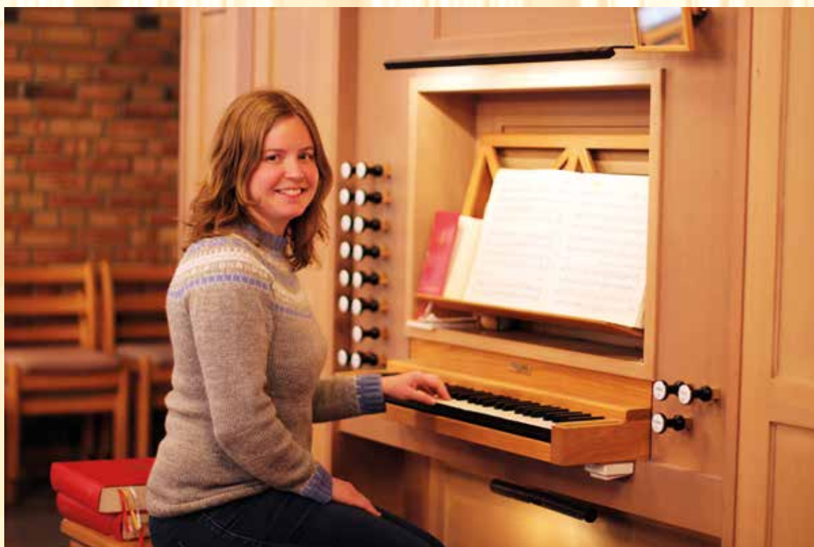
Organisten skal lede menigheten i sangen og er med på å underbygge budskapet som presten ønsker menigheten skal sitte igjen med.