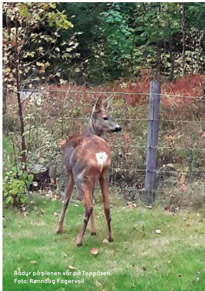
Rådyr på plenen vår på Toppåsen.

Strætkvern, G.O. 2010. Elgens ( Alces alces ) bruk av ulike over- og underganger langs fire hovedveier på Østlandet. Universitetet for Miljø og Biovitenskap.