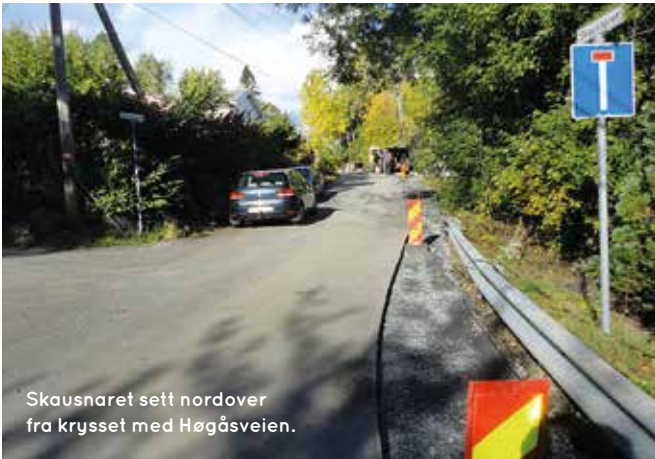
Skausnaret sett nordover fra krysset med Høgåsveien.