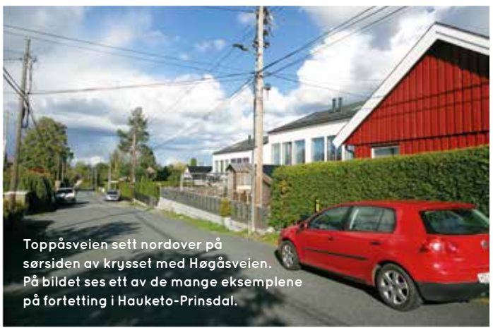
Toppåsveien sett nordover på sørsiden av krysset med Høgåsveien. På bildet ses ett av de mange eksemplene på fortetting i Hauketo-Prinsdal.