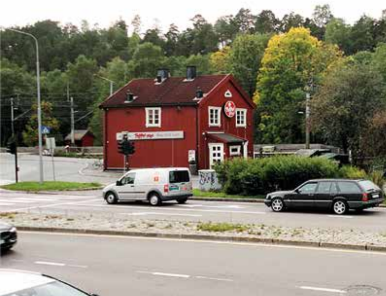
Hauketo stasjon med Nedre Prinsdals vei i forgrunnen, sett fra Hauketo senter. Kollstien fører fra parkeringsplassen til høyre for stasjonsbygningen, under jernbanelinjen i den trange undergangen som kan skimtes midt på bildet. Eiendommene i Kollstien ligger på den andre siden av jernbanelinjen.