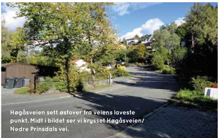
Høgåsveien sett østover fra veiens laveste punkt. Midt i bildet ser vi krysset Høgåsveien/ Nedre Prinsdals vei.