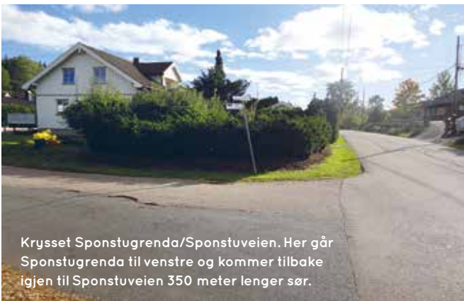
Krysset Sponstugrenda/Sponstuveien. Her går Sponstugrenda til venstre og kommer tilbake igjen til Sponstuveien 350 meter lenger sør.