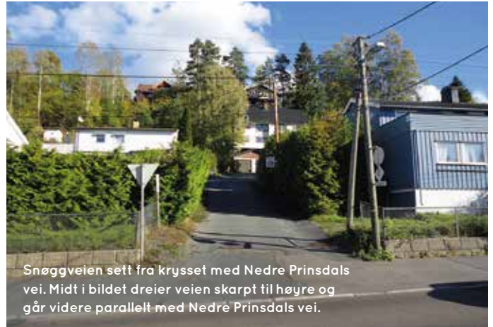
Snøggveien sett fra krysset med Nedre Prinsdals vei. Midt i bildet dreier veien skarpt til høyre og går videre parallelt med Nedre Prinsdals vei.