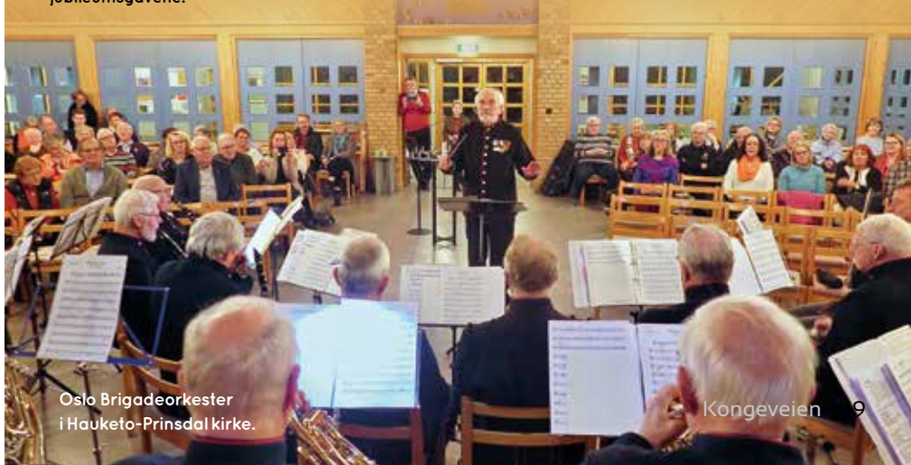
Oslo Brigadeorkester i Hauketo-Prinsdal kirke.