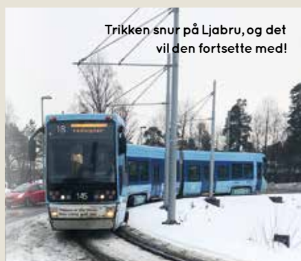
Trikken snur på Ljabru, og det vil den fortsette med!