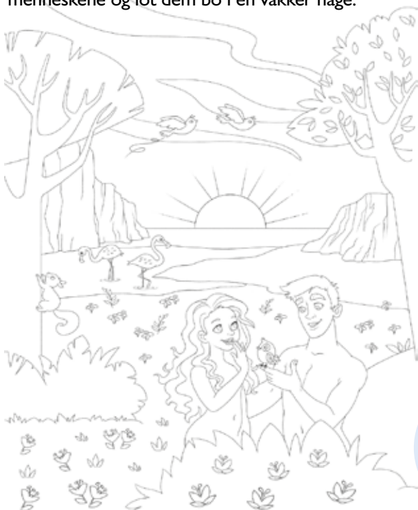
Tegninger: Francesca De Luca

Gud skapte de første menneskene og lot dem bo i en vakker hage.