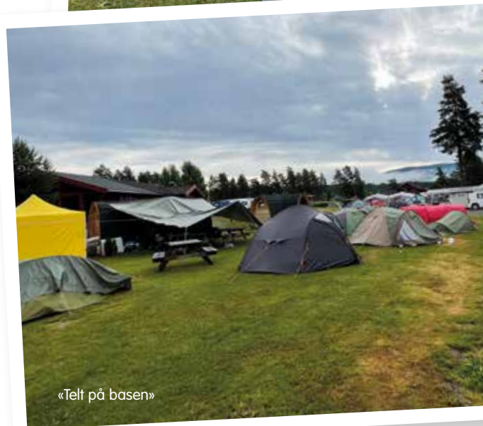
«Telt på basen»