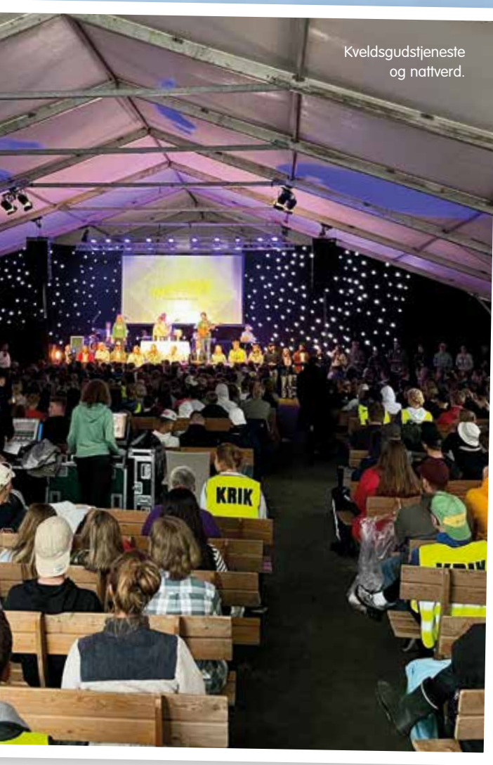
Kveldsgudstjeneste og nattverd.

>> nyheten om terrorhandlingen som hadde skjedd i Oslo. Slike hendelser kan sette tanker og følelser i sving, og selv om dagene gikk med til aktiviteter og lek, så ble det under leiren gitt plass til samtale, stillhet og lystenning. Ellers gikk dagene med til typiske leiraktiviteter: lite søvn, mye sosialt, undervisning, allsang, kortspill, workshops og fellesmåltider.