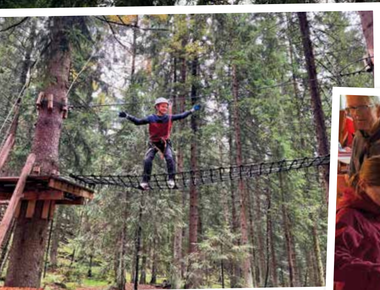
Spennende øvelser og flott skogsnatur – perfekt for speiderjungen!