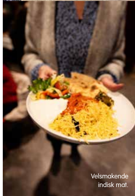
Velsmakende indisk mat.