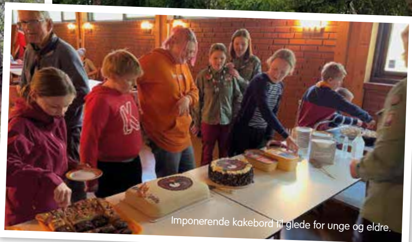
Imponerende kakebord til glede for unge og eldre.