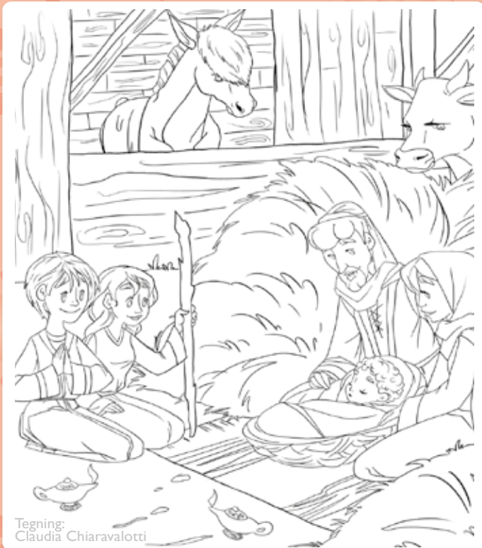
Tegning: Claudia Chiaravalotti

Jesus, Guds egen sønn, ble født i en stall i Betlehem.