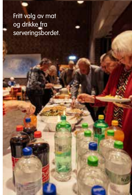
Fritt valg av mat og drikke fra serveringsbordet.