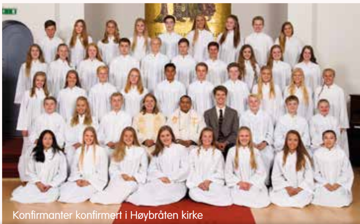
Konfirmanter konfirmert i Høybråten kirke