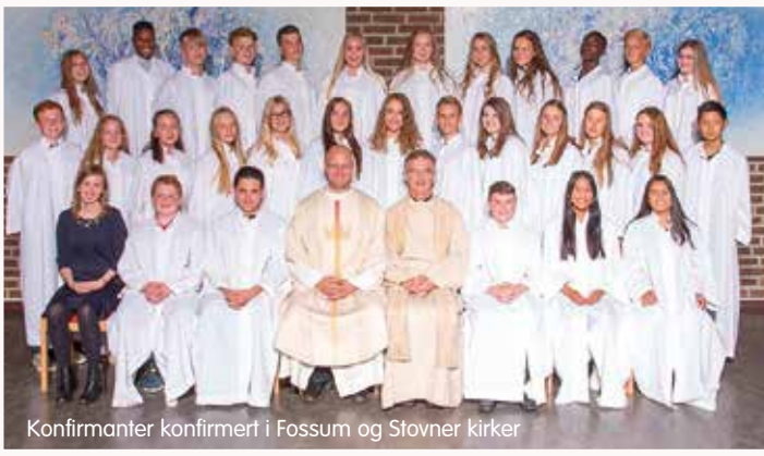
Konfirmanter konfirmert i Fossum og Stovner kirker