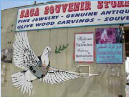
Freden er skjør. Freden må vernast. Fred er vårt håp.