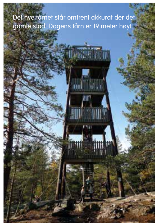
Det nye tårnet står omtrent akkurat der det gamle stod. Dagens tårn er 19 meter høyt.

I vinter ble fire 17 meter lange stolper fløyet opp på Grønliåsen med helikopter og mon-