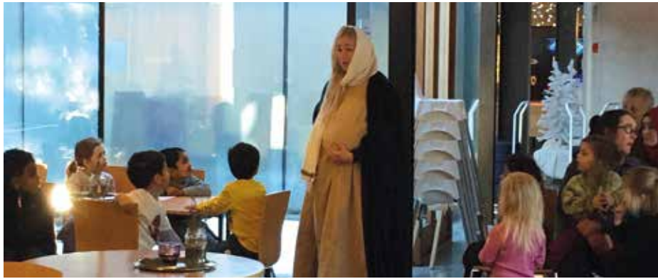
Hele kirkerommet tas i bruk på adventsvandringen for barnehagebarn fra Nasaret til Betlehem.