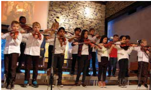
Fiolinopplæring har en lang tradisjon på Stenbråten skole. Her deltar 5. klassinger på julegudstjenesten.