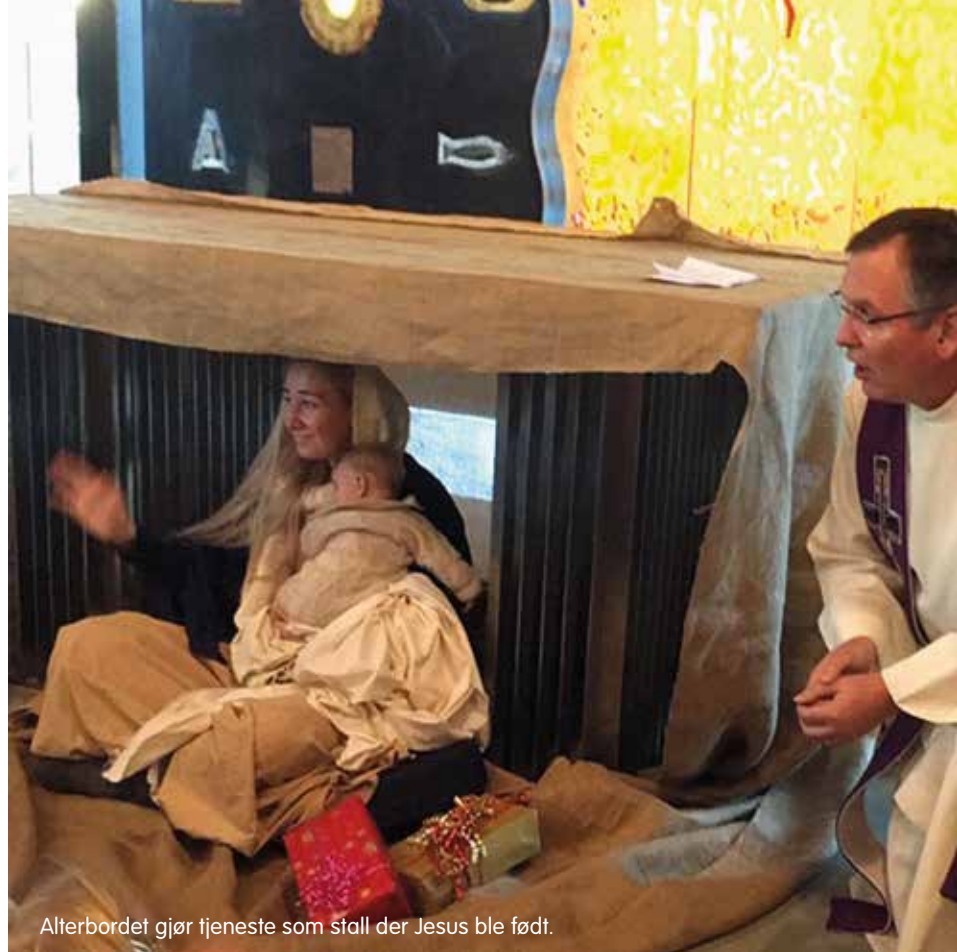
Alterbordet gjør tjeneste som stall der Jesus ble født.