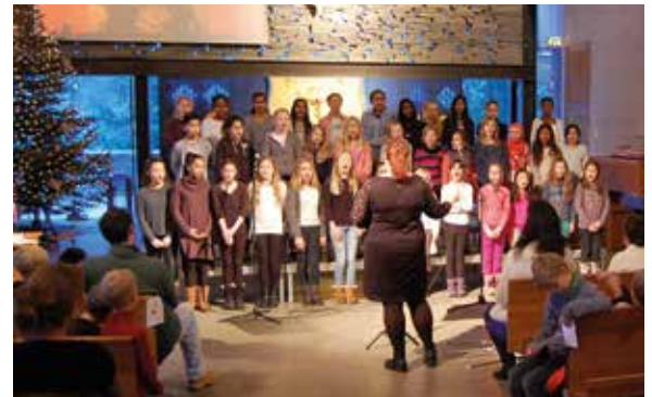
Skolekoret på Stenbråten skole deltar på julegudstjenesten i Mortensrud kirke.