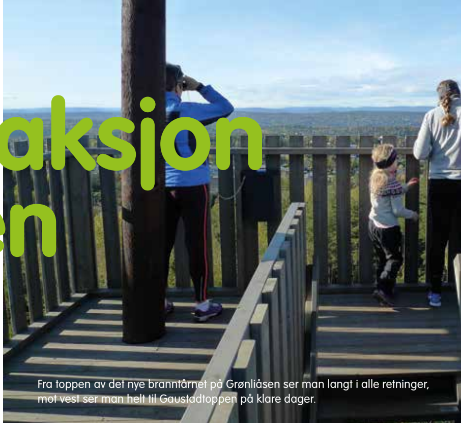
Fra toppen av det nye branntårnet på Grønliåsen ser man langt i alle retninger, mot vest ser man helt til Gaustadtoppen på klare dager.

Høyt rager det, og godt besøkt er det, det nye branntårnet som er reist på Grønliåsen. Hver dag strømmer unge og voksne til tårnet for å kunne se langt. På klare dager ser du Gaustadtoppen.