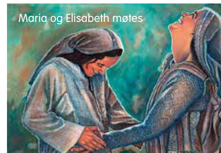
Maria og Elisabeth møtes

Velkommen til retreat i hverdagen i Mortensrud kirke!