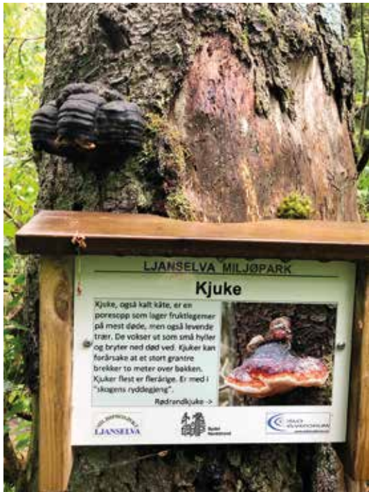
28 slike skilt er hengt opp langs elva som forteller om planter, dyr, fugler og kulturminner.