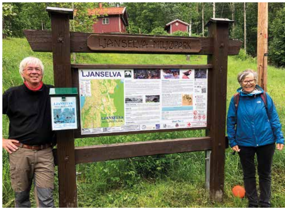
Åtte steder er det satt opp informasjonstavler om kultur og natur langs Ljanselva, som her ved Sagdammen, med Sagstua i bakgrunnen.