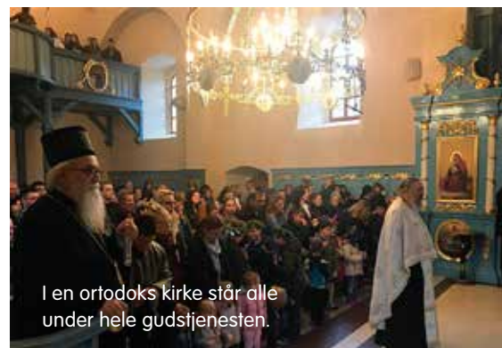
I en ortodoks kirke står alle under hele gudstjenesten.