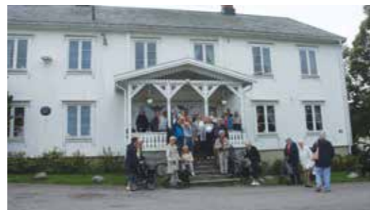
Turdeltakerne samles til middag på Lambertseter gård etter tur til Holocaustmuseet.