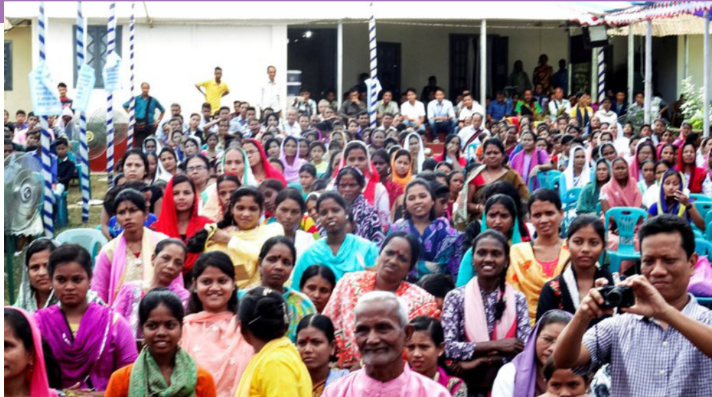
Illustrasjonsfoto fra Normisjon

I Bangladesh har de ikke de samme velferdsgodene som vi har. Skolegang er ikke noe alle får. Gjennom Normisjonen er Manglerud menighet med på å støtte 17 skoler som sikrer over 800 barn og unge skolegang. Utdanning er viktig for alle barn. Skolegang er et viktig virkemiddel for å hjelpe barn og familier ut av fattigdom. Barn og unge i Bangladesh har også ønsker om hva de vil bli. La oss løfte blikket, se dem og hjelpe dem til en bedre fremtid.