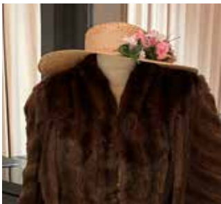
Vi ønsker oss fine lopper til kirkenes loppemarked s.32