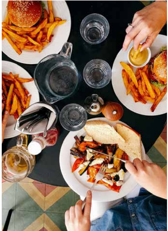
Velkommen til kirkemiddager i Nordberg. Første gang onsdag 29. mai kl 16.15. Husk å melde deg på til .....? innen mandag 27. mai før kl 20.00. Rekker du ikke denne middagen, kommer nye sjanser til høsten. Det blir annonsert i augustnummeret av menighetsbladet.

- Vi må ta et beløp som kan dekke råvarene vi kjøper inn, en pris for familier og en for enkeltpersoner. Vi har ikke fastsatt hva dette blir ennå, men vi ser at andre steder har de operert med en familiepris på 100 kr og 50 kr for dem som kommer alene.