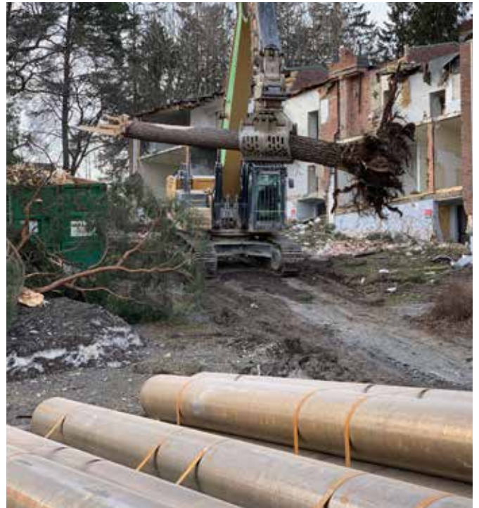
De gamle familieboligene er nå borte. De ble bygget på 50-60-tallet og trengte sårt til renovering.