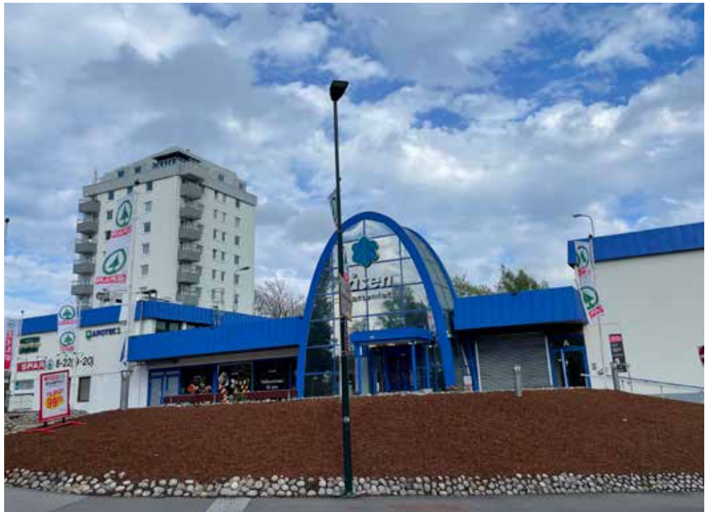
Diskusjoner om utbygging av kjøpesenteret på Tåsen og boligområdene rundt har pågått i 12 år. Planene er ennå ikke godkjent av Plan- og bygningsetaten. Velet jobber med et eget forslag til utbygging. Forslaget kommer før sommeren.

– Vi har kontakt med lokalpolitikere i bydelsutvalget og i kommunen, og selvsagt med PBE, sier Iversen.