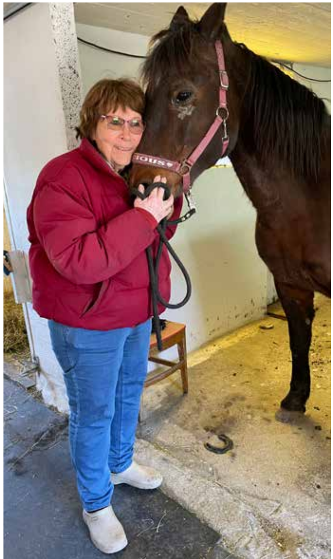
Kontakten med hester gir fremdeles stor glede.