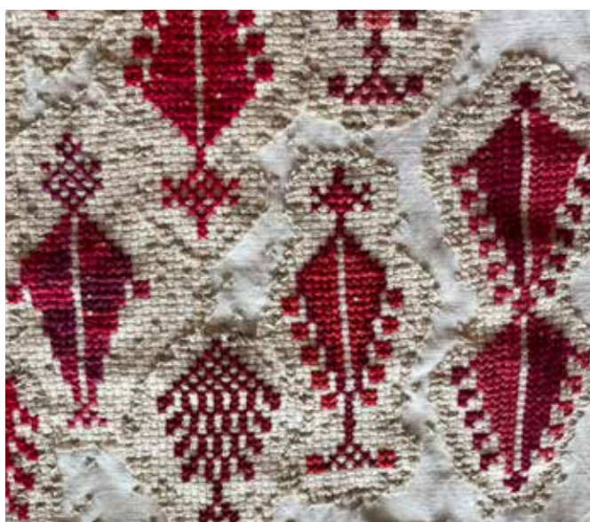
Her ser vi ulike varianter av det palestiske sypresstreet som danner en skog. I resten av bildet (se forsiden) er det en krigsherjet scene med missiler og opprevne trær. Motivet er hentet fra en kjole til en palestinsk kvinne som sydde sine krigserfaringer inn i kjolen. Dette er håndbrodert og er tidkrevende arbeid.

- Familien min er veldig raus. De lar meg bruke spisestua i huset som atelier. Det flommer over