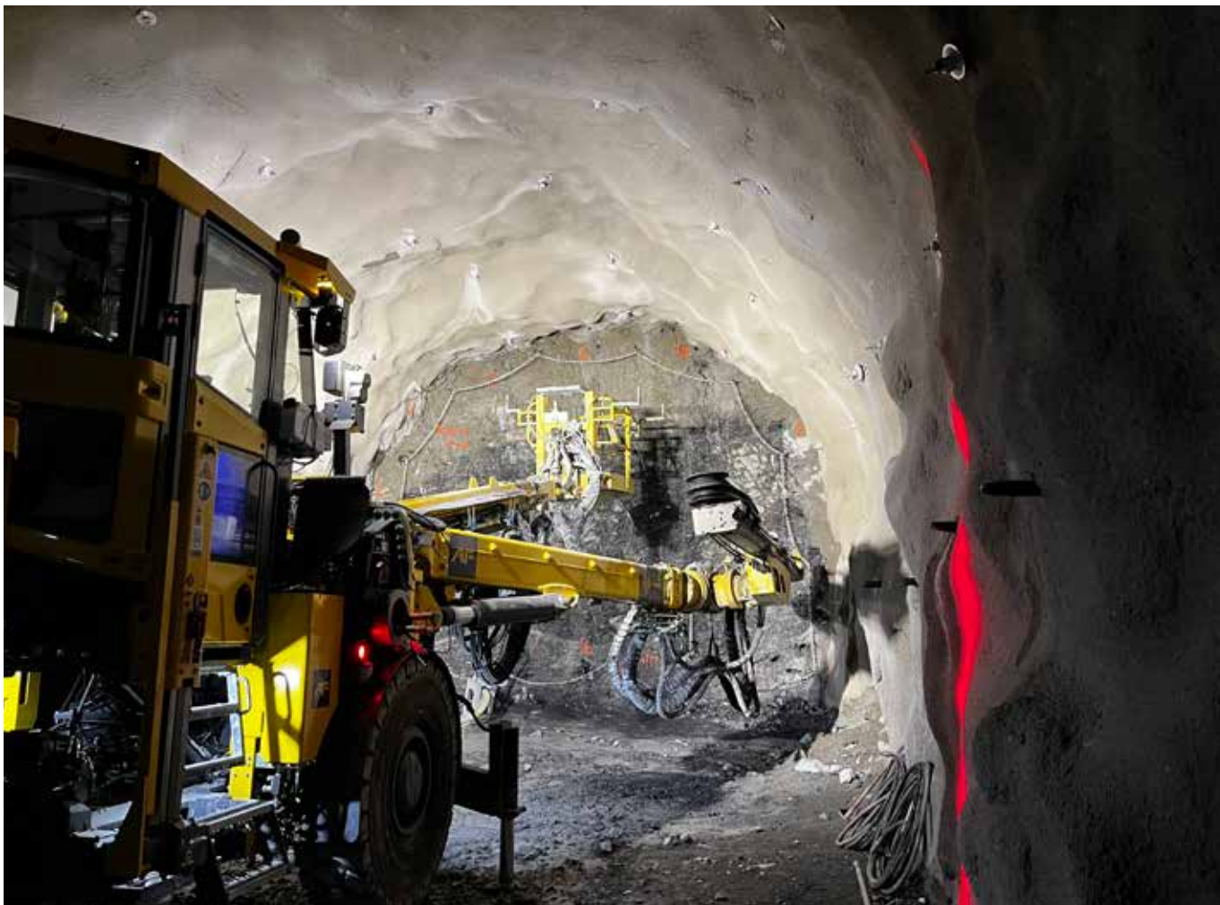
Det sprenges ny kabeltunnel fra Sogn til Ulven for å ivareta det stadig økende behovet for strøm.