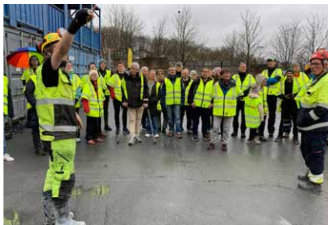
De som bor på Rektorhaugen og Tåsen, kan merke utbyggingen. Derfor inviterte Statnett til åpen dag på Ullevålsletta. De 70-80 som møtte opp, fikk god informasjon - med kaffe og brus til.