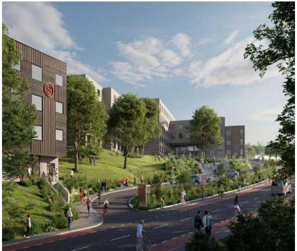
Den nye studentbyen med 417 ett- og to-romsleiligheter, vil stå ferdig i 2026.