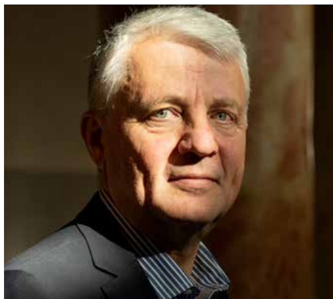
Generalsekretær i Kirkens Nødhjelp Dagfinn Høybråten kommer til Nordberg 20. mars.

- Kirkens Nødhjelp ble grunnlagt på tanken om global nestekjærlighet da norske menigheter sammen sendte nødhjelp til hjelpetrengende sivile i Tyskland etter andre