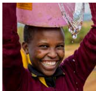
Rent vann til alle - et mål for årets fasteaksjon. s. 4 og 16