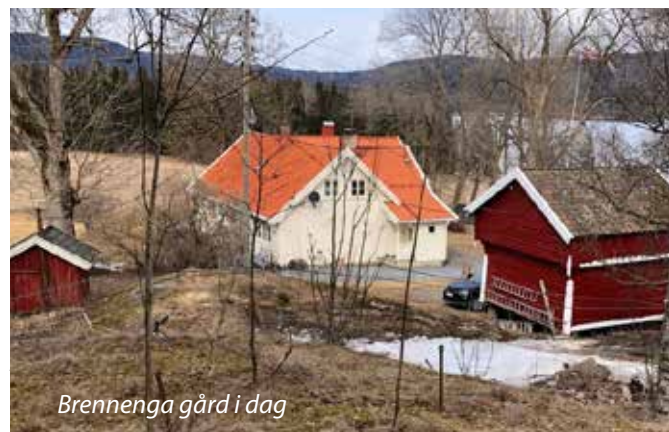
Brennenga gård i dag