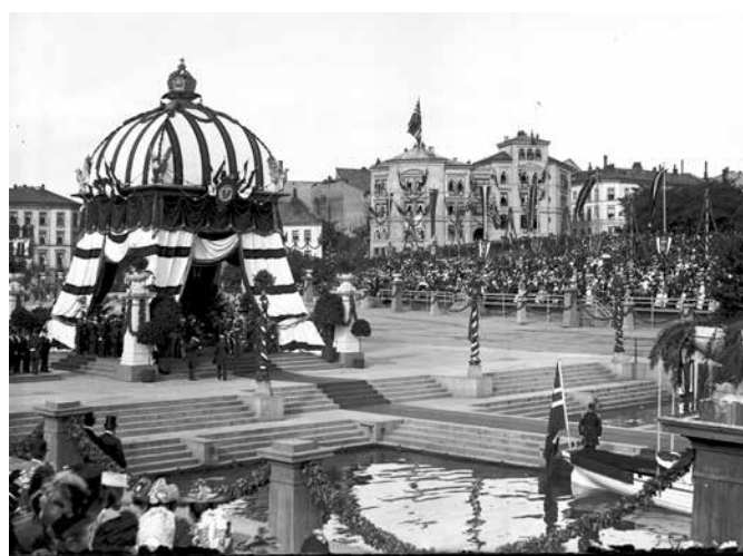
Keiser Wilhelm ble tatt imot med pomp og prakt da han la til kai i Oslo. I følget hadde han både underholdningartister og krigsskip.

Holmenkollveien fra hoppbakken til Frognerseteren ble anlagt i 1890, og fikk da navnet