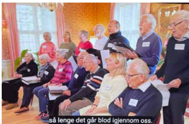
så lenge det går blod igjennom oss.

I afrikanske tradisjoner er de døde en del av et fellesskap av levende og døde. I det fjerne Østen blir de døde æret i årlige