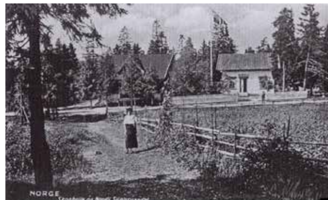
Dette bildet viser de to kafeene Skogheim og Nordli ved Sognsvann. Begge ble borte da Idrettshøyskolen ble bygget. Dette og 435 andre spennende historiske bilder kan du finne i bildebasen til Sogn historielag.

Navnet til en av husmannsplassene som lå under Nordberg gård (Holsten) er gitt til en av