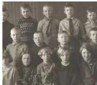
Historielaget 40 år. Gamle fotos på nettsidene. s.10