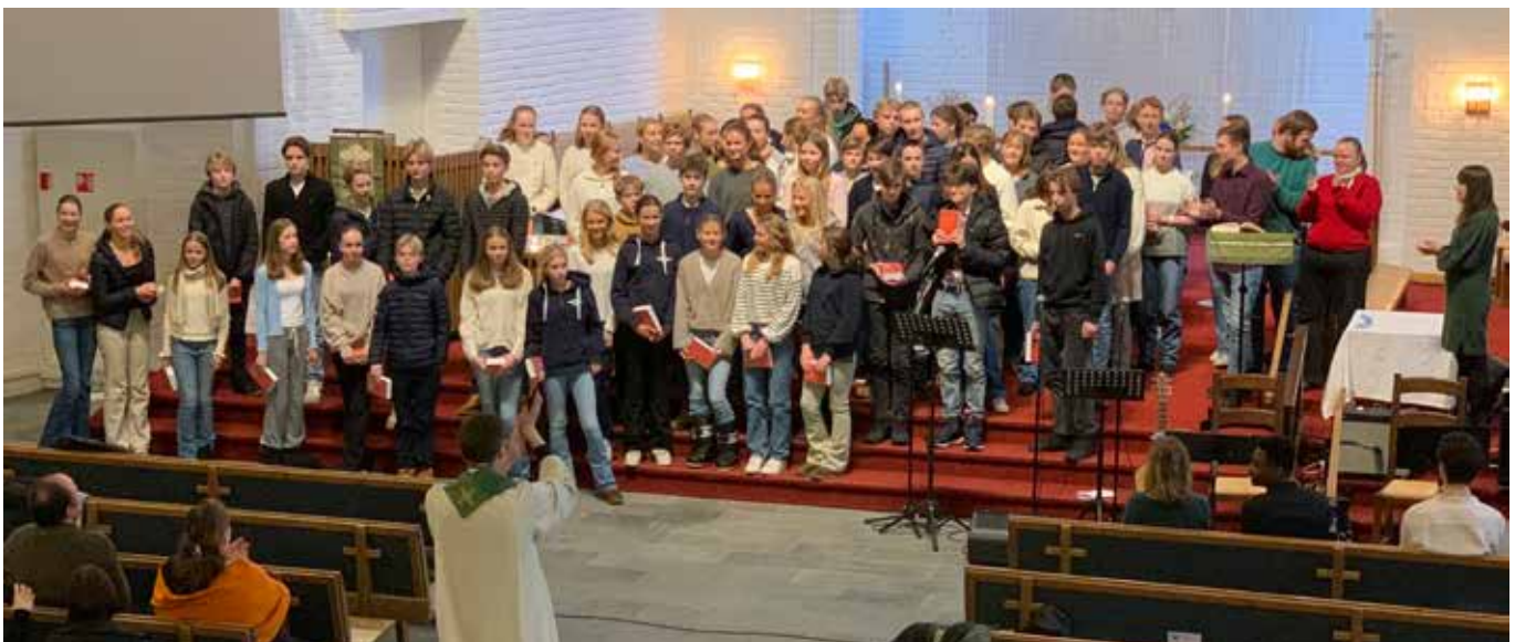
Søndag 15. januar ble det nye konfirmantkullet presentert for menigheten. Kapellanen har, sammen med andre, ansvaret for konfirmantundervisningen. Han gleder seg til å bli kjent med de nye konfirmantene.