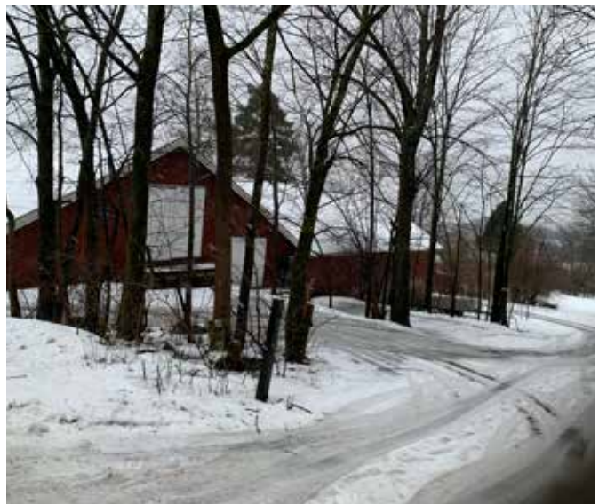
Nordberg gård ble først registrert som kirkegods i 1347, men den er trolig etablert i folkevandringstiden eller tidligere.