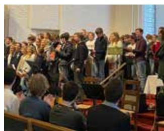
Nytt konfirmantkull. Kapellanen gleder seg. s.7