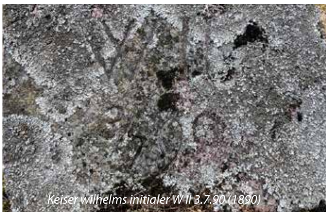
Keiser wilhelms initialer W II 3.7.90 (1890)