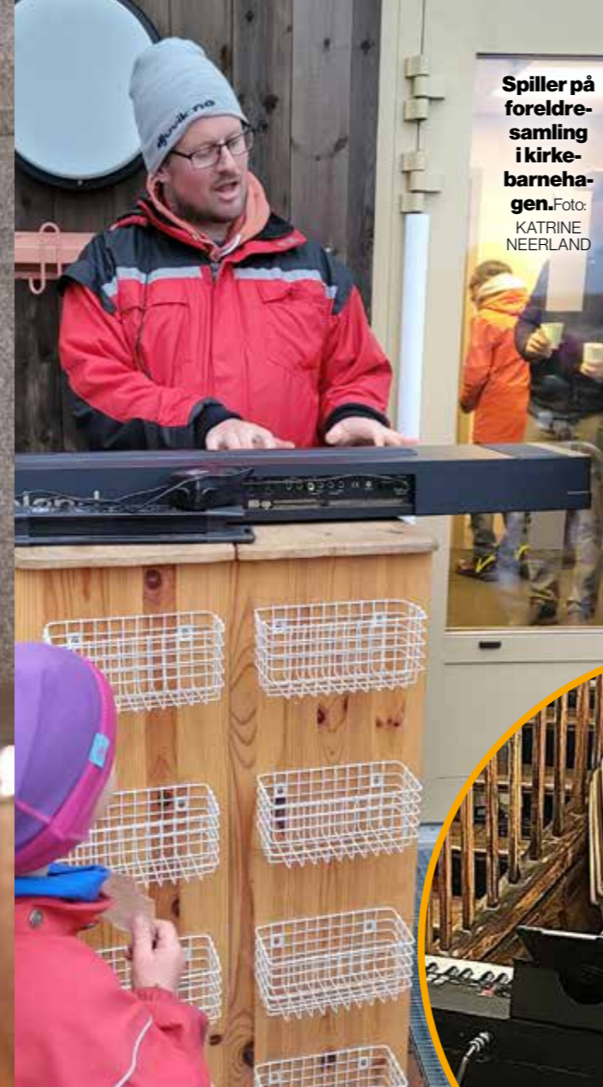
Spiller på foreldresamling i kirkebarnehagen.