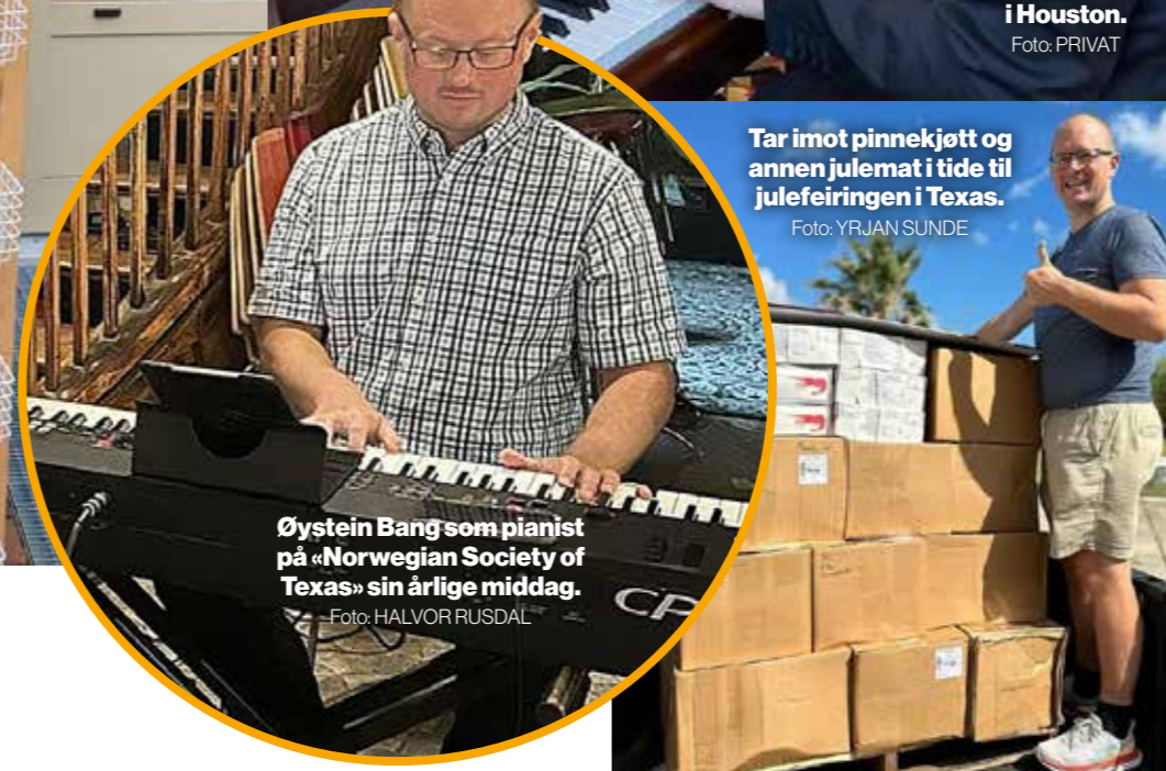
Tar imot pinnekjøtt og annen julemat i tide til julefeiringen i Texas.