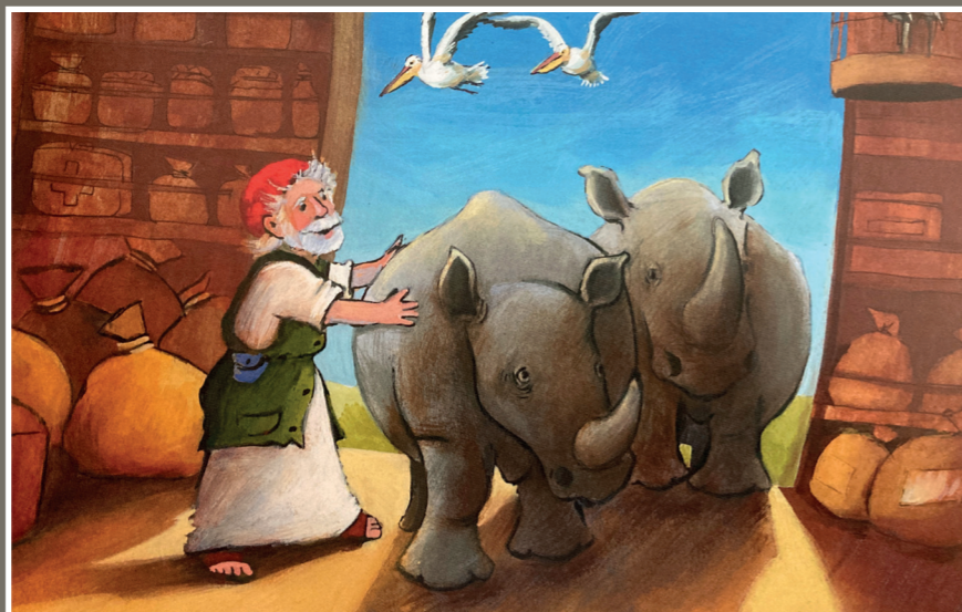
Noah og hans ark er kanskje en av Bibelens mest kjente fortellinger. Nå er navnet det mest brukte i Norge i 2021. Illustrasjon fra Bibelselskapets Min store barnebibel, 2016.