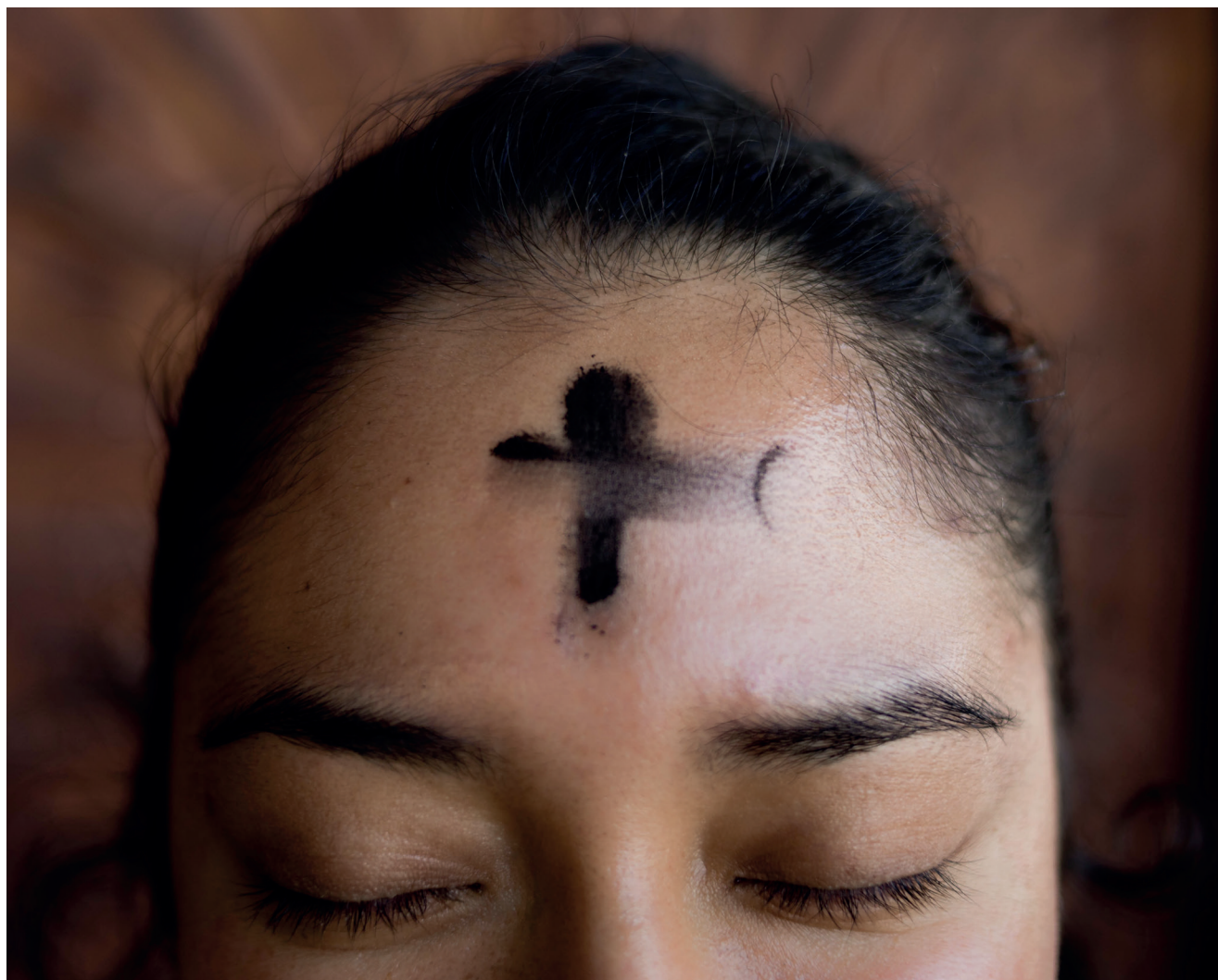
Mange kirker har gudstjeneste askeonsdag, ofte med tegning av askekors.