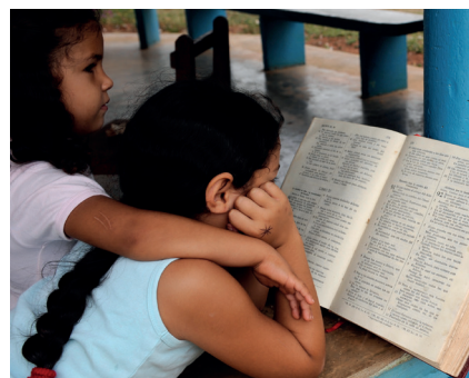
Søstrener liker å lese i Bibelen.