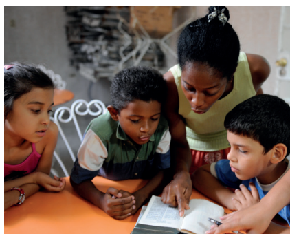
Barna på søndagsskolen ønsker at de også hadde en barnebibel.