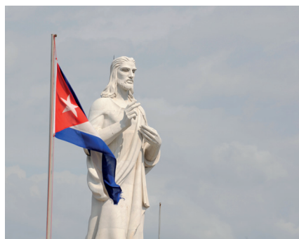
Kristusstatuen og flagget er det første du ser ved innseilingen til Havana.