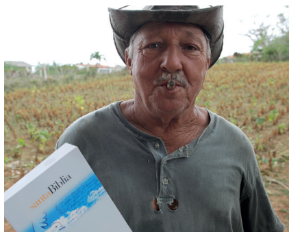
Sigarbonden tar med glede imot en bibel.