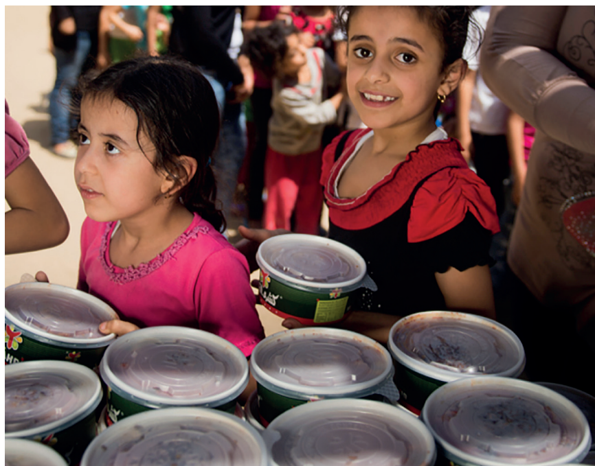
Barn i Kairos «søppelby» får et mer verdig liv.

Barna som omgis av alt det rikfolk kaster fra seg, får hver dag høre at de selv er verdifulle og elsket. Stefanusbarnas motto er: «Jeg kan!»