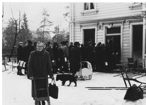
Da svenskesuppa dukket opp under krigen, var det kvinneorganisasjonene som fikk ansvaret for utdelingen. Nordstrand Tuberkuloseforening fikk låne melkebutikken på Sætergrend til formålet. Her køer kvinnene opp for å få fylt spannene med suppe, et kjærkomment tilskudd til den magre krigskosten.