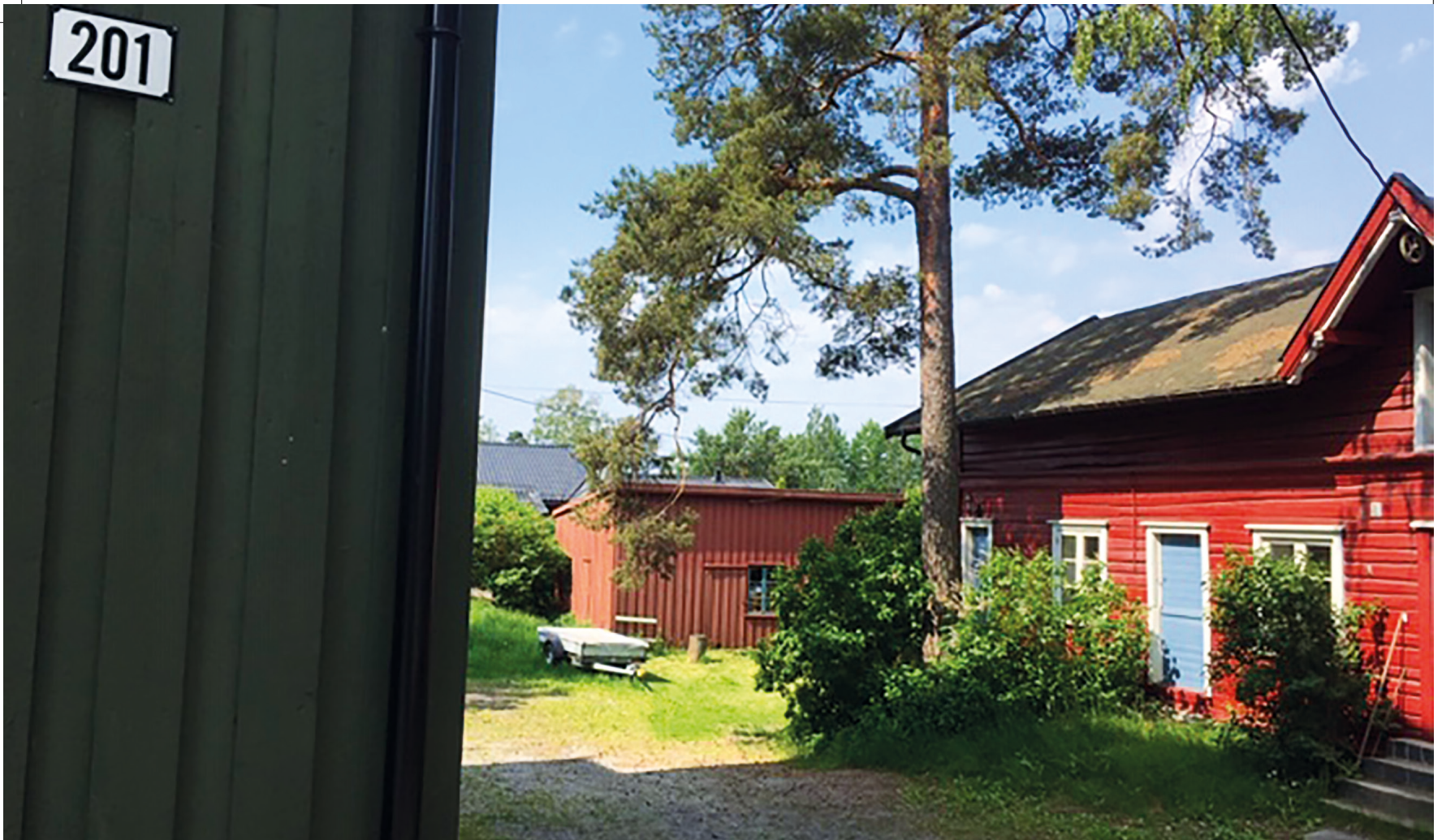
Under den lille arken til høyre henger fortsatt et hjul som forteller at man heiste høy og andre varer opp på loftet, en nødvendig innretning i en tid da kolonialforretningene også solgte kull, koks og ved.