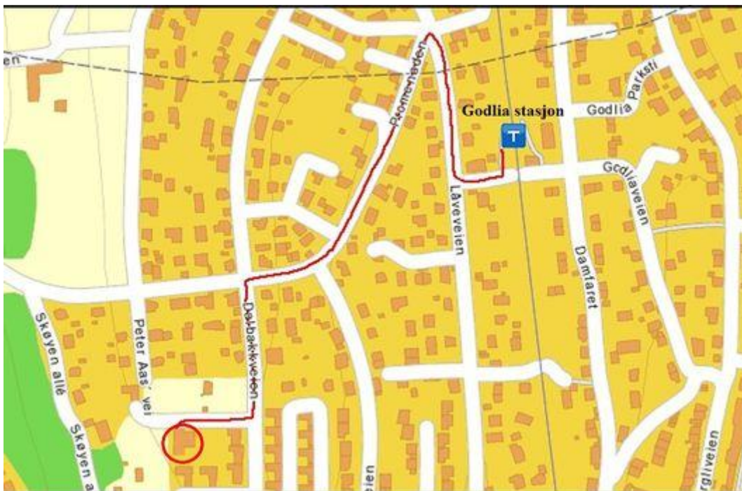
Gange fra Godlia t-banestasjon