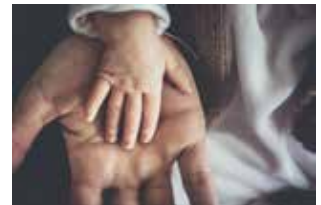
Vi velsigner og ber for hverandre.