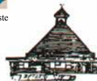
Søndre Skøyen kapell

Søndag 26. mai 6.s. i påsketiden 1 Kong 3,5–14 Ef 3,14–21 Matt 6,7–13