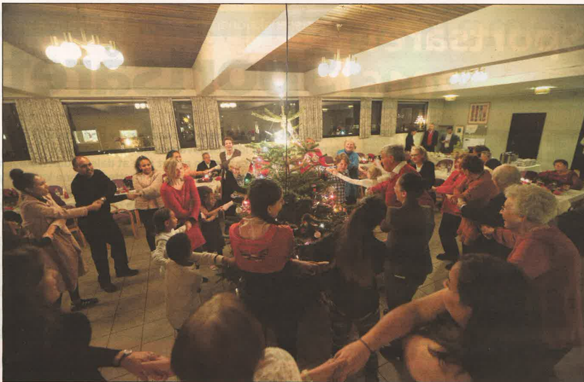
RUNDT HAUGERUD-TREET: Ingen julaften uten gang rundt juletreet. Gammel som ung var med.