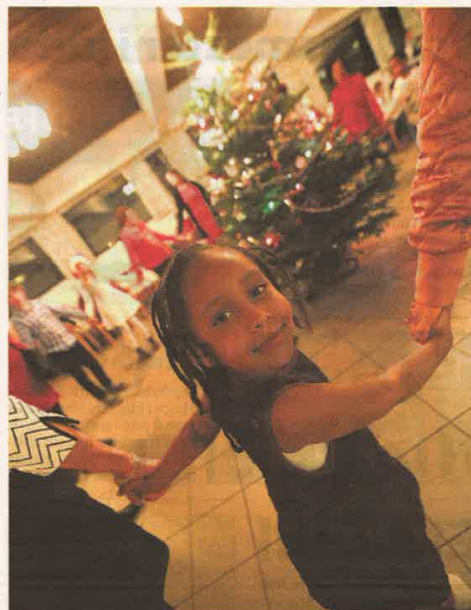
LITE SJARMTROLL: Yorusalem var selvsagt med i gangen rundt juletreet.