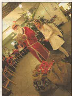
LITEN HJELPER: Julenissen hadde så mange gaver med seg at han måtte få litt englehjelp til å dele dem ut alle.