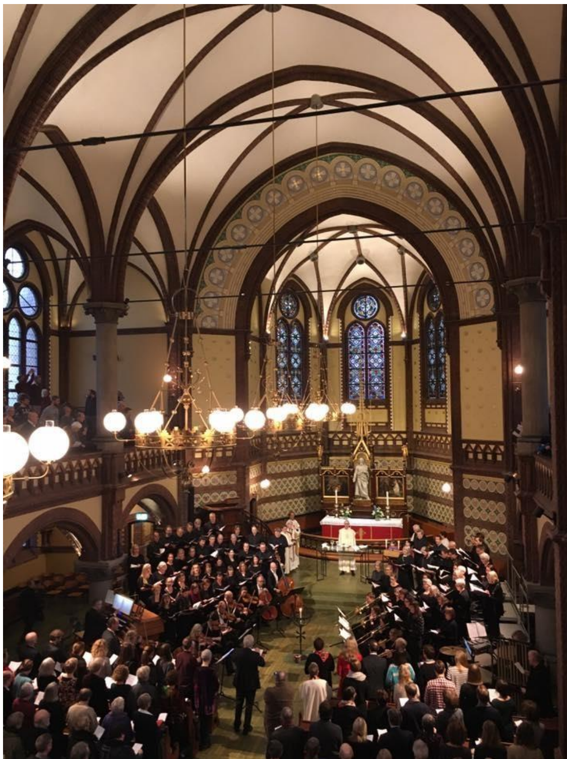
Fra gjenåpningsgudstjenesten i Paulus kirke 26. november 2017