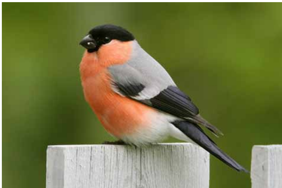
Dompap på hagegjerdet mai 2009

- Jeg er for frivillighet! Egentlig er det også litt tilfeldig at vi har kommet der vi er, men jeg opplever vi er styrt inn i noe meningsfullt, på en fin måte.