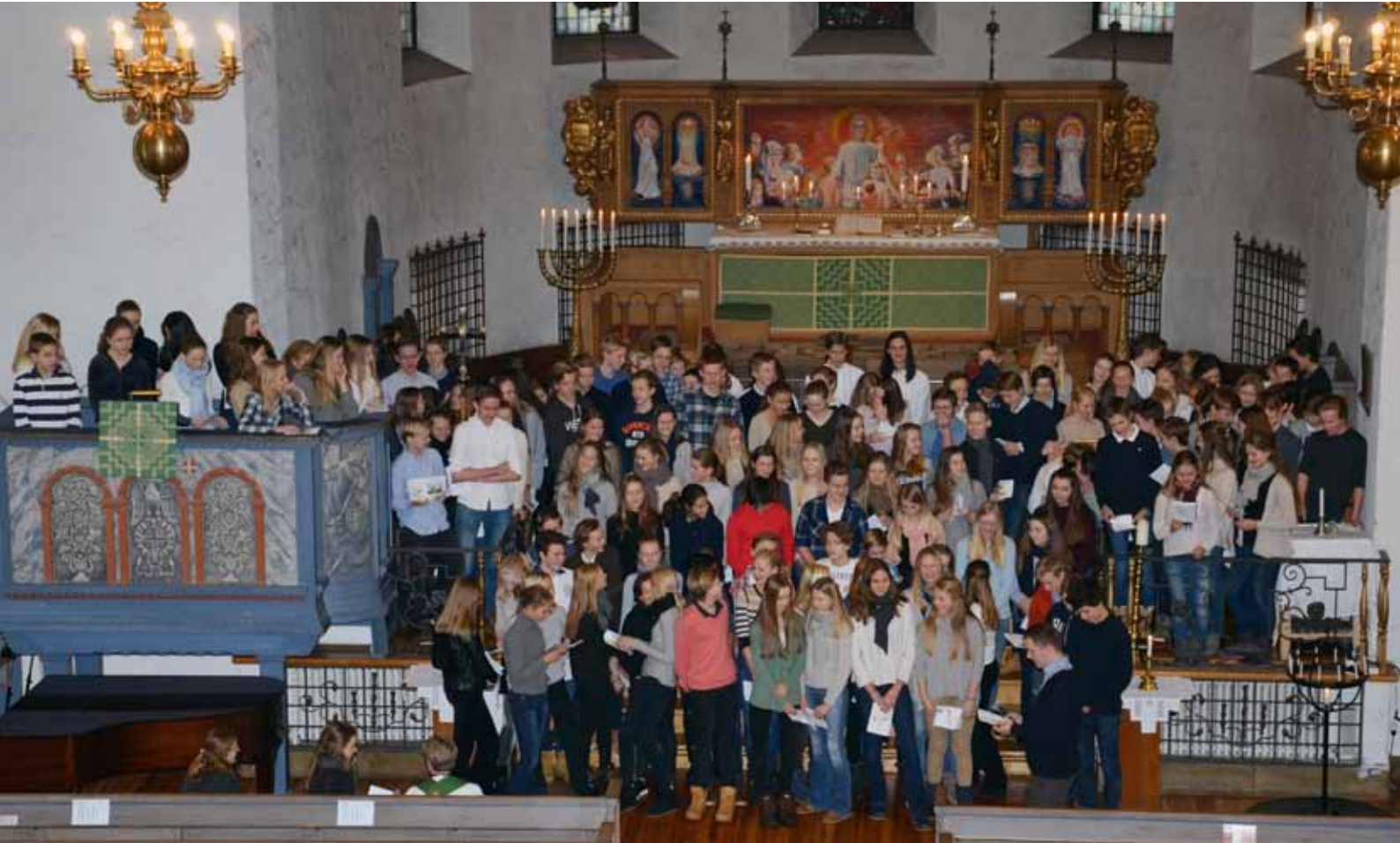
159 konfirmanter begynte sin konfirmasjonstid siste helgen i januar. Årets konfirmantkull ble presentert på gudstjenesten i Ris kirke 1. februar.