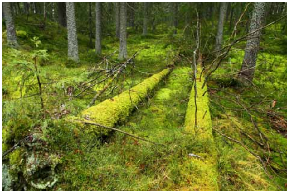
"Skogsinteriør" - ved Lille Åklungen nord for Sognsvann en høstdag.