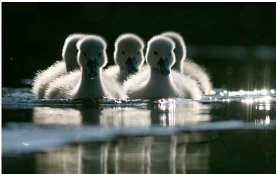
Knoppsvaneunger på Holmendammen juni 2009